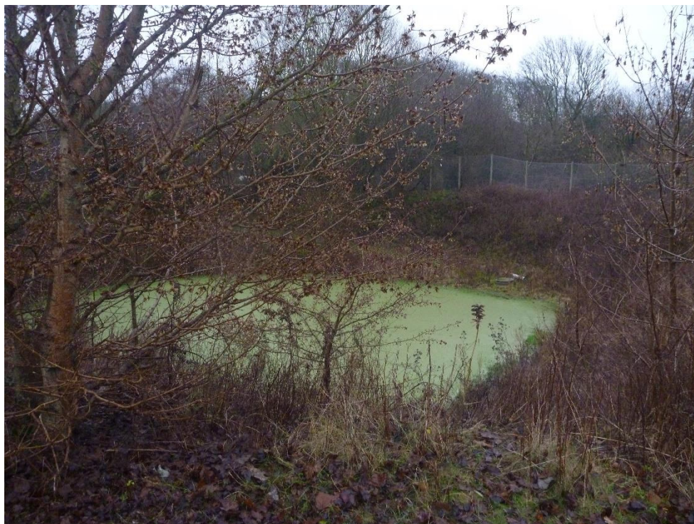
Branddam i den sydlige del af deponiet.

Sortering af læs til forbehandling sker på celle 12.