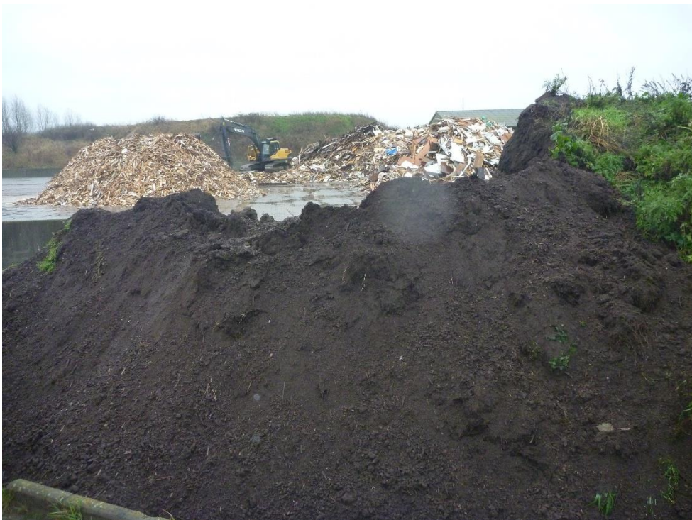
kompost der afsættes til landbrug. Oplag på celle 9-10.