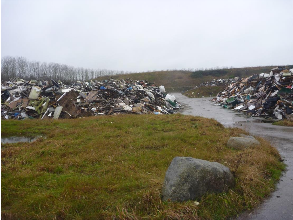
-Forbrændingseget affald: Celle 3 + 5