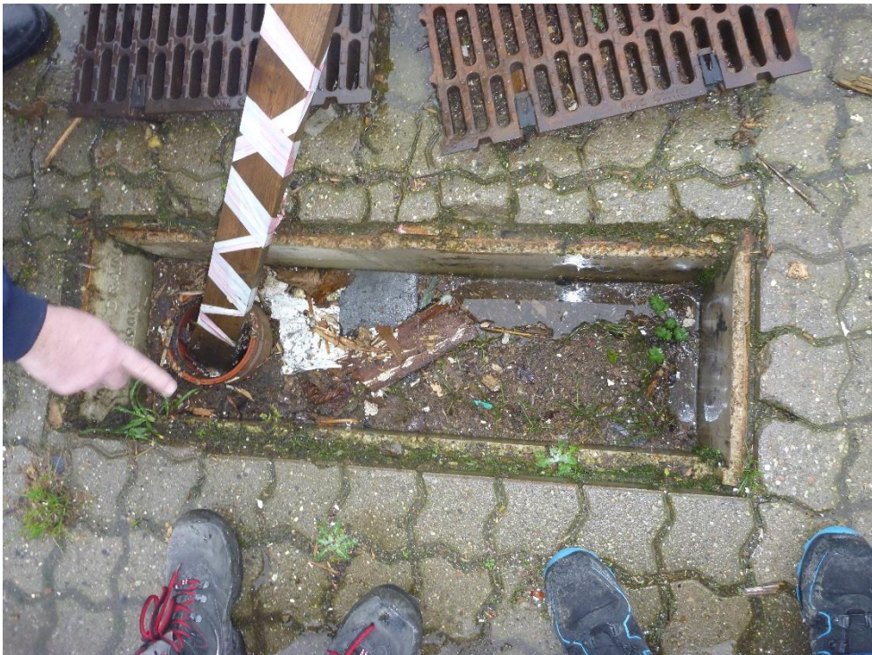
Tilsyn med afledning af overfladevand.