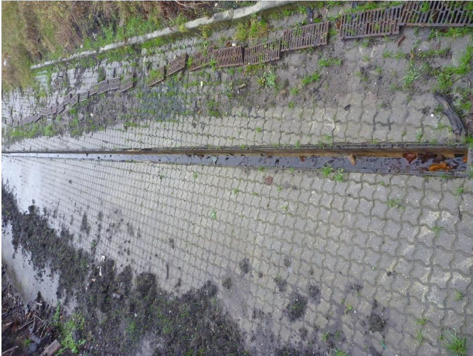
Tilsyn med afledning af overfladevand.