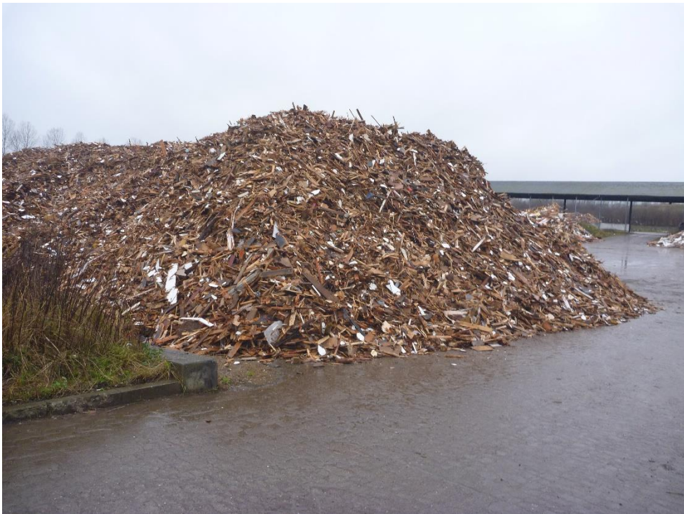
Oplag af træ til videre forarbejdning.