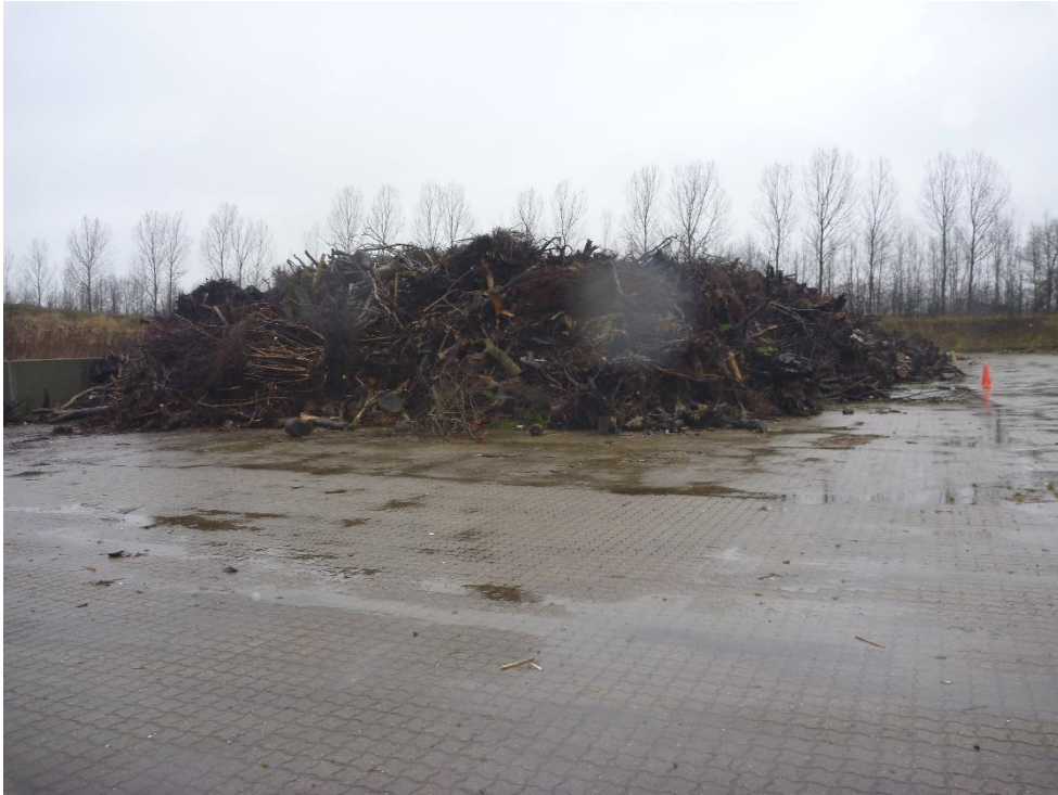
Oplag af træstød til videre forarbejdning.