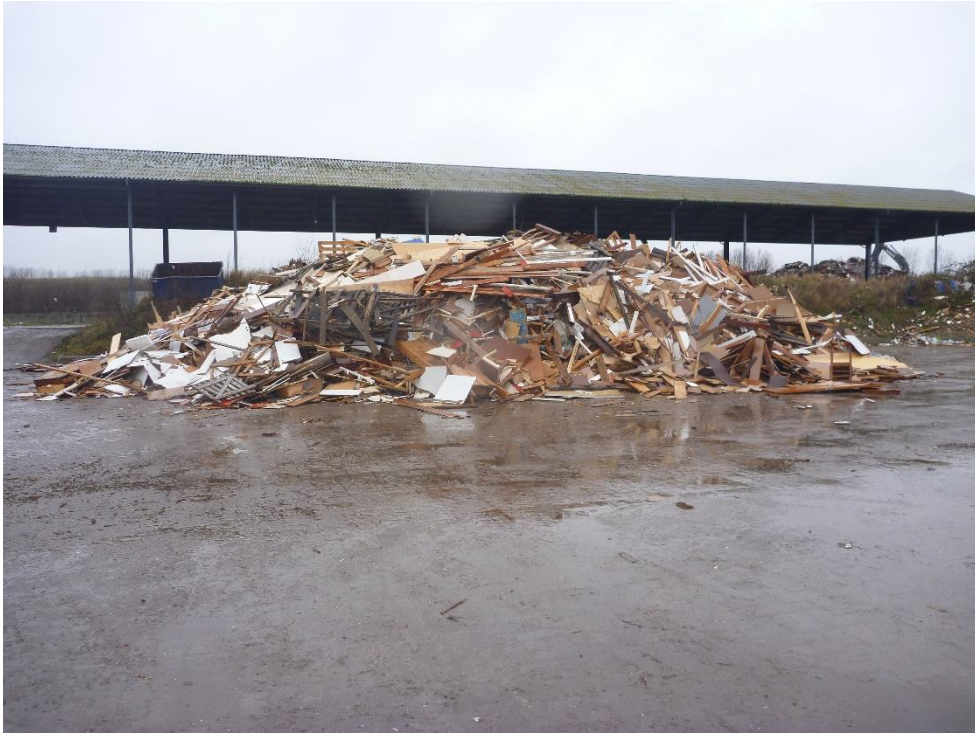
Oplag af træ til neddeling på celle 9-10.