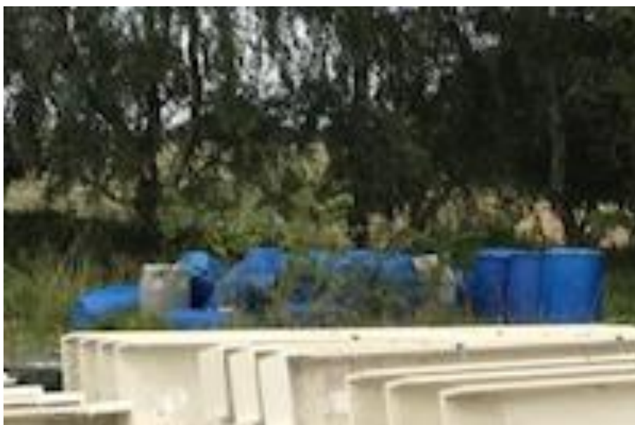
Billede 4. Billede fra virksomhedens udendørsplads omkring lagerbygningerne. Billedet er taget fra fra bygningens sydlige side.