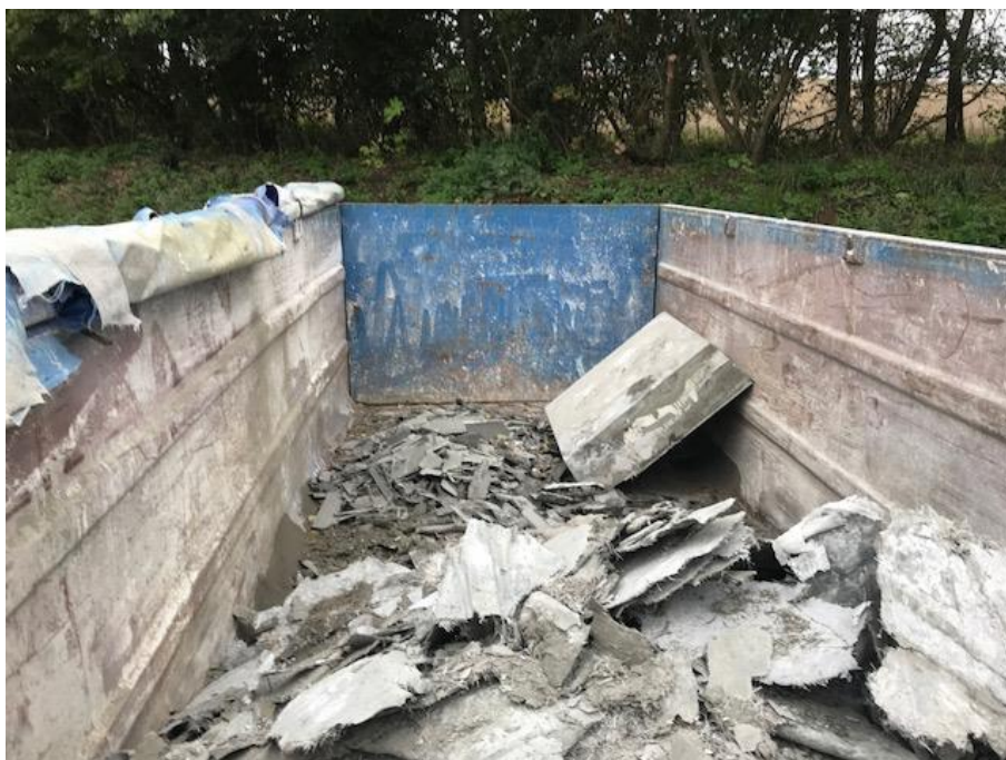
Billede 5. Container med cement affald.

Virksomheden har anskaffet forskellige containere til deres affald. Affaldssorteringen foregår korrekt og affaldet bliver kildesorteret.