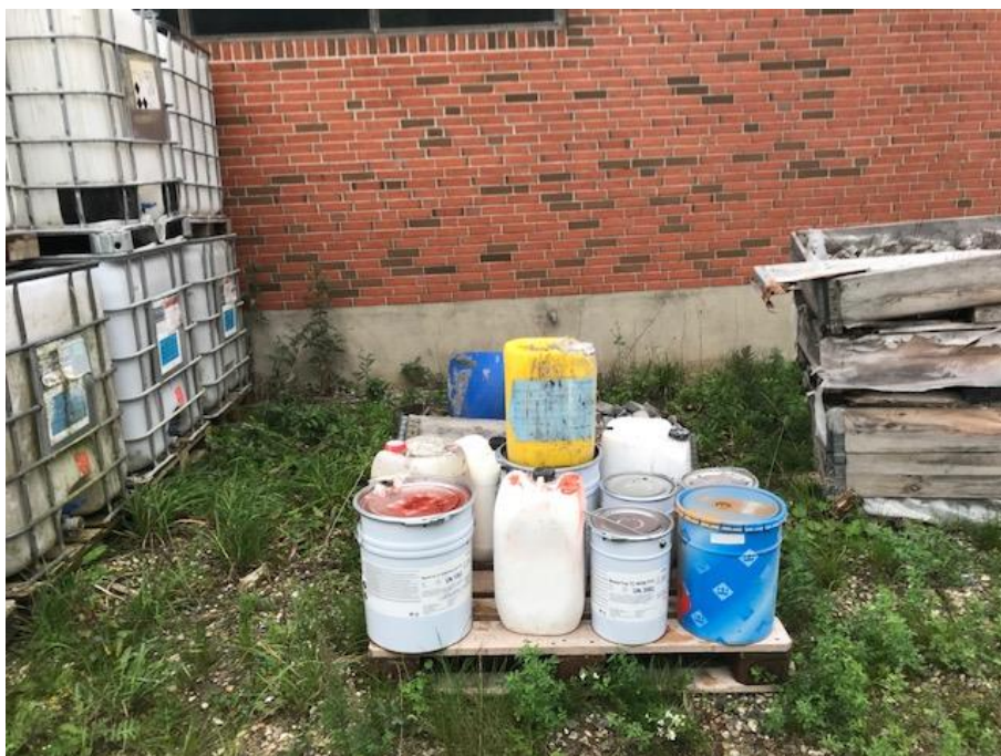
Billede 8. Oplag af kemikalier på virksomhedens udendørs areal.

På baggrund af ovenstående henstillede Norddjurs Kommune, at kemikalierne umiddelbart skulle flyttes fra den pågældende plads og opbevares miljømæssigt forsvarligt.