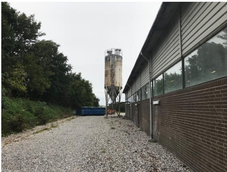
Billede 2. Billede fra virksomhedens udendørsplads omkring administrationen og produktionsbygningen. Billedet er taget fra fra virksomhedens østlige side (fra syd mod nord).