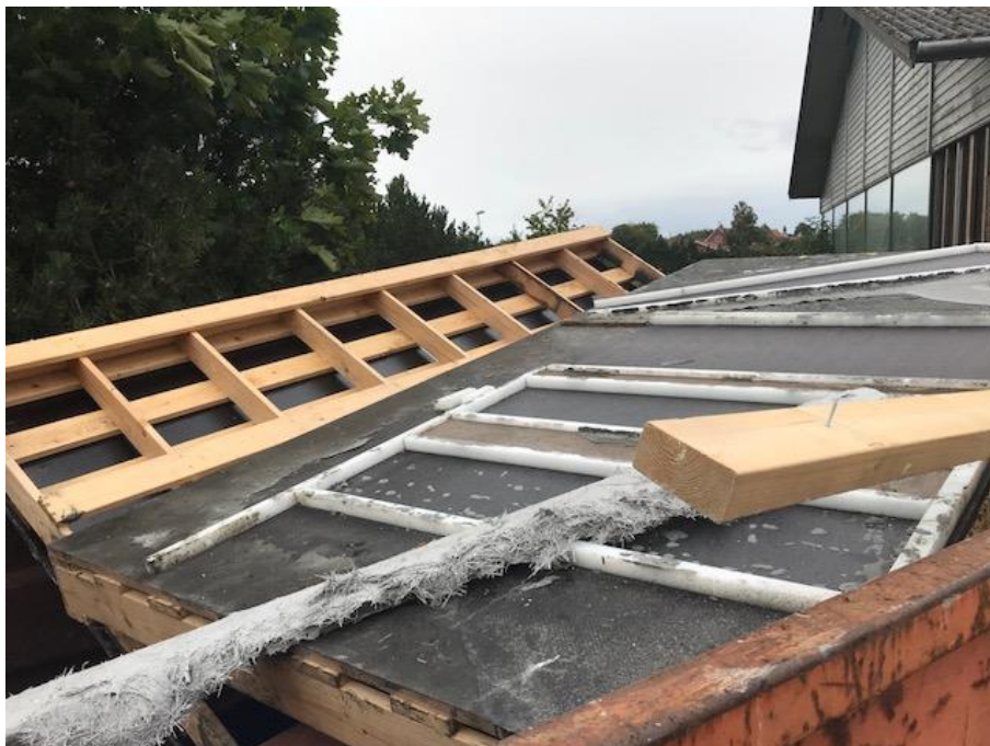
Billede 7. Container med brandbart affald.