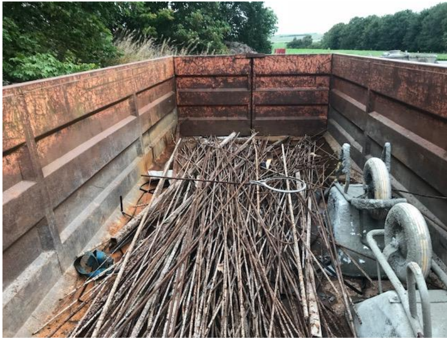
Billede 6. Container med metal affald.