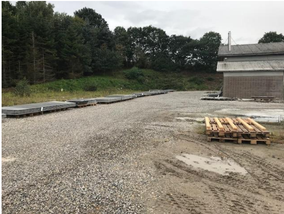
Billede 1. Billede fra virksomhedens udendørsplads omkring administrationen og produktionsbygningen. Billedet er taget fra virksomhedens sydlige side (fra vest mod øst).