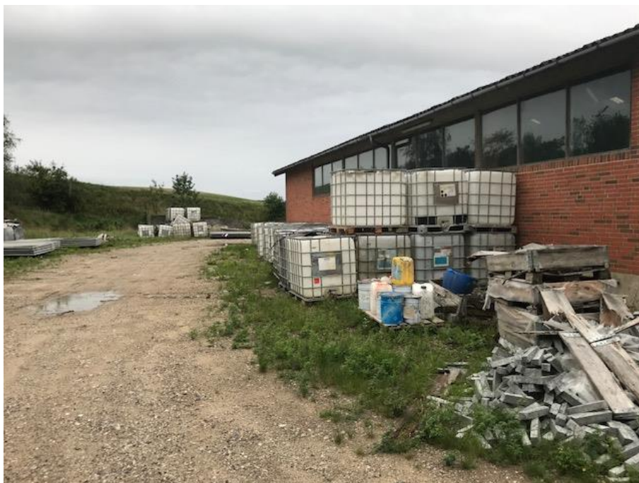
Billede 3. Billede fra virksomhedens udendørsplads omkring lagerbygningerne. Billedet er taget fra fra bygningens østlige side (fra nord mod syd).

Der er dog stadigvæk et oplag af palletanke og træaffald, plastictonder m.v ved virksomhedens lagerbygninger på den modsatte side af vejen i forhold til administrationsbygningen og produktionen, se nedenstående billeder.