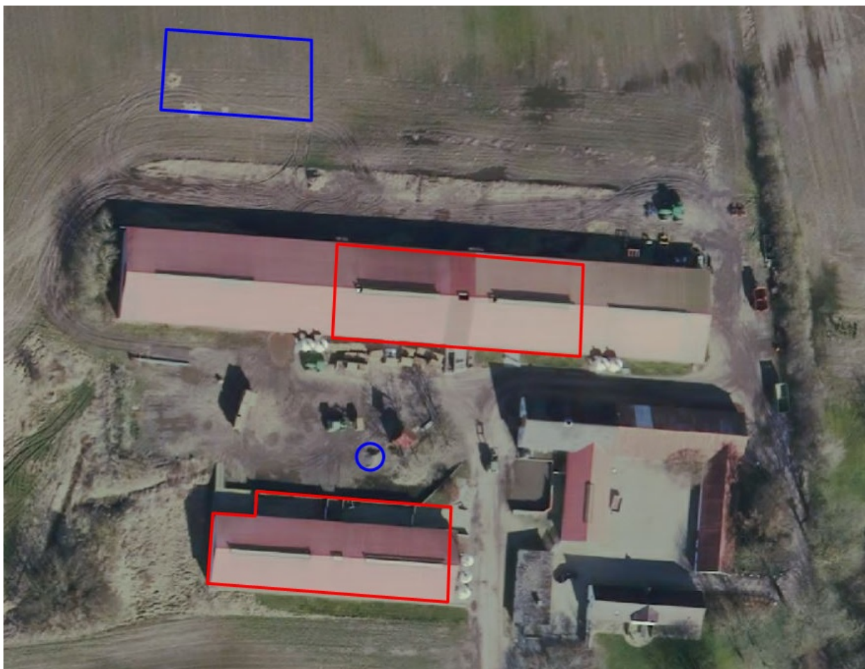
Luffoto: Indtegning af husdyrbrugets stalde (rød streg) og opbevaringsanlæg for husdyrgødning (blå streg). Bemærk, at indtegningen af markstakken er helt vilkårlig, idet en markstak skal flyttes hvert år og derfor ikke kan indtegnes med en fast placering.

I revurderingen skal fordampningen af ammoniak beregnes ud fra produktionsarealet, dvs. det samlede stiareal i samtlige bygninger samt overfladen af opbevaringsanlæg for husdyrgødning. Produktionsarealet er anslået ud fra "brutto-areal-metoden". Ved denne metode er arealet af den synlige tagflade af staldene opmålt i luftfoto til 1.847 m 2 . Herefter er produktionsarealet anslået en anelse mindre (1.830 m 2 ). Indtegningen af produktionsarealer kan ses i luftfotoet nedenfor: