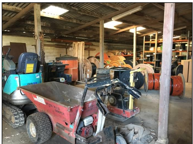
Foto fra garagen med opbevaring af få maskiner og kabeltromler i baggrunden, samt lagerreol

Hverdage efter behov inden for kl. 7 – 16.