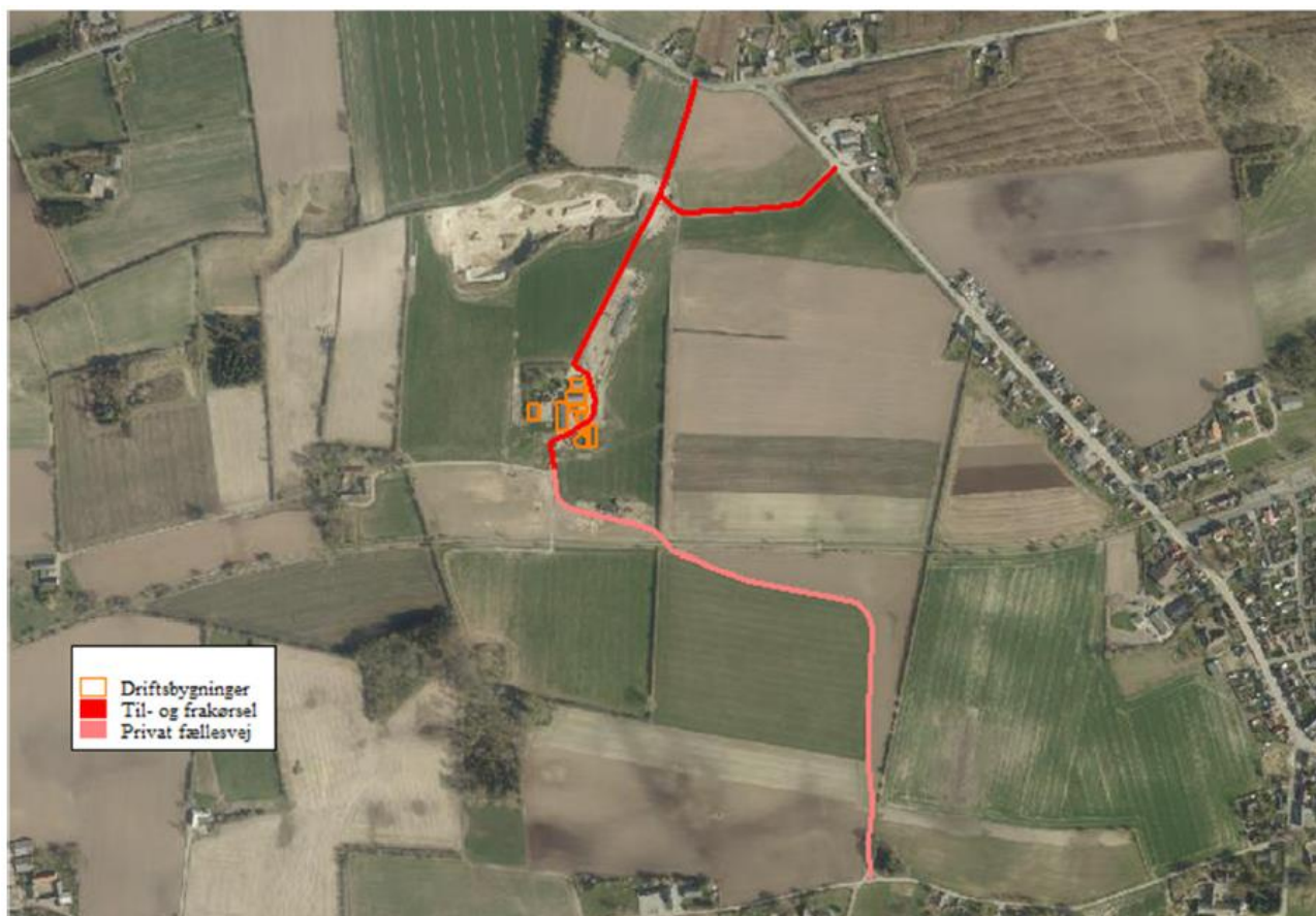
Figur [4.1]. Til- og frakørselsveje til ejendommen

Antallet af transporter er relativt begrænsede, da der er tale om et mindre husdyrbrug. Transporternes antal og art er vis i tabel [4.3] nedenfor.