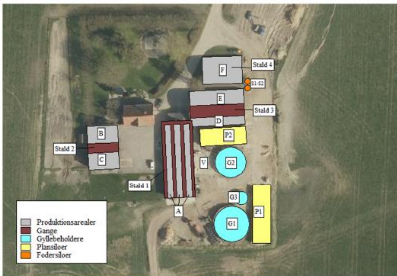
Figur 2.3. Oversigtskort med angivelse af produktionsarealets placering.