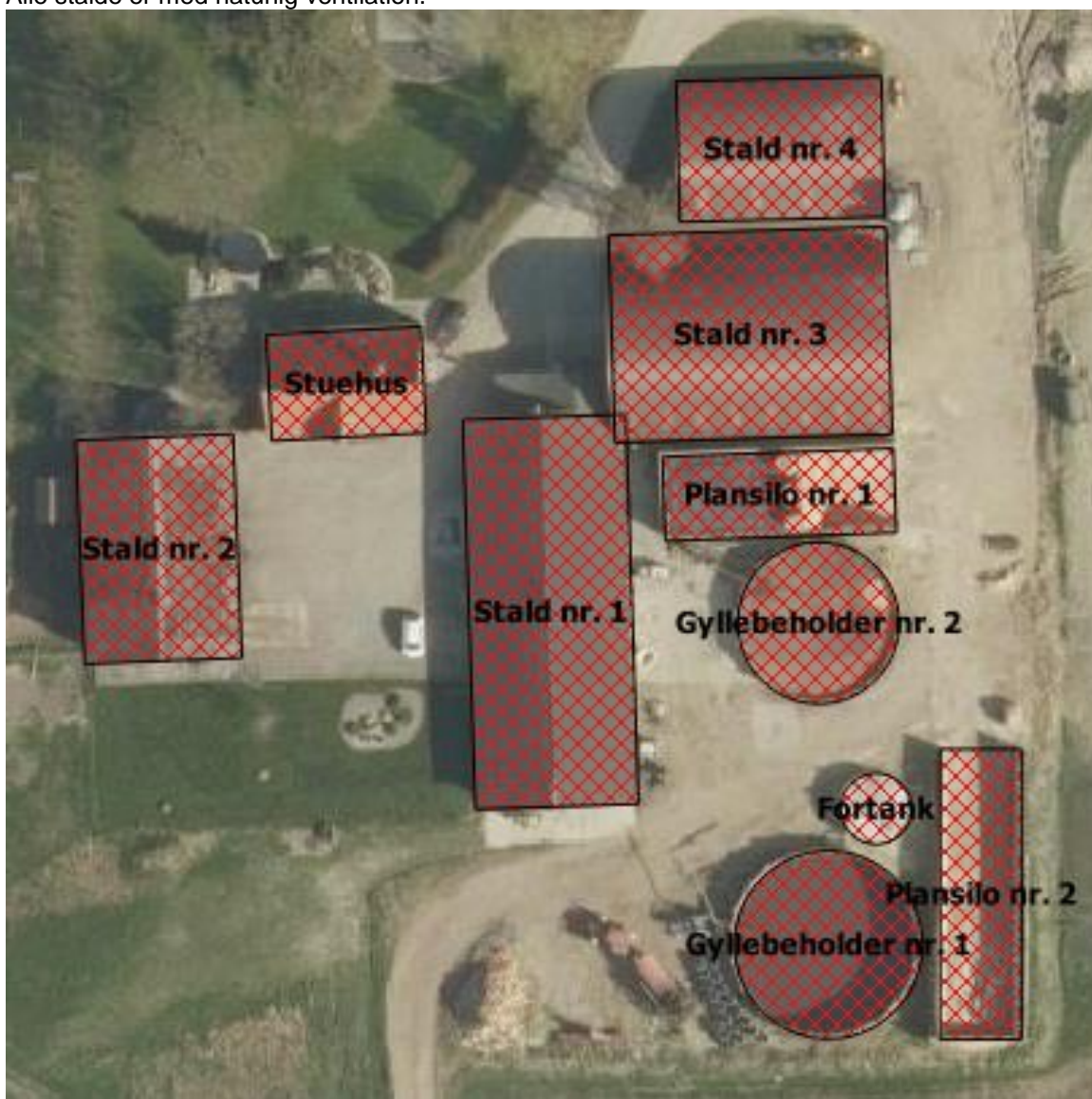
Figur 2.2. Oversigtskort over husdyrbrugets staldanlæg.

Alle stalde er med naturlig ventilation.