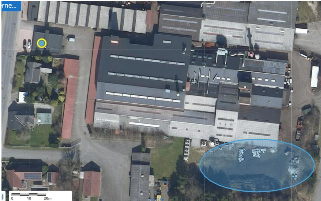
Placering af brugt støbesand. GIS-kort fra foråret 2021.