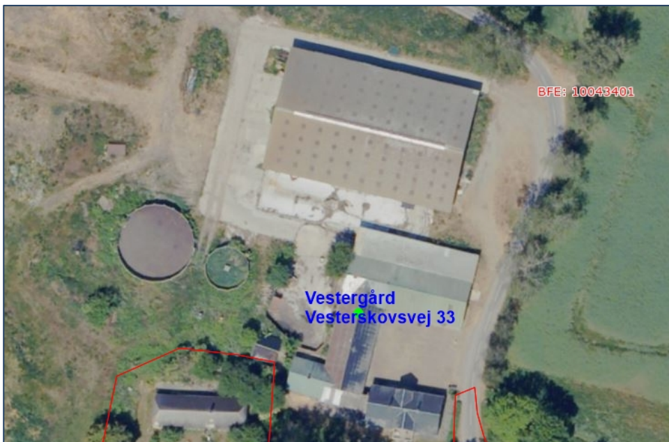
Figur 1: Vestergård, Vesterskovsvej 33, 5960 Marstal, Ærø.

Svendborg Kommune opfordrer alle til at skrive sikkert via Digital post. Derfor bør du aldrig sende fortrolige personhenførbare oplysninger (CPRnr. helbreds- og økonomiske oplysninger) i en almindelig mail. Læs mere: https://www.svendborg.dk/om-kommunen/digital-post-og-selvbetjening