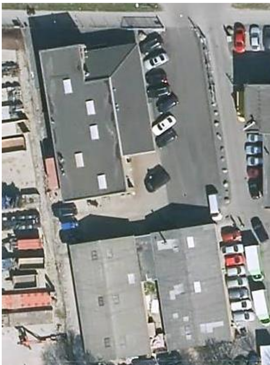
Luftfoto af virksomheden

I forhold til kommuneplanen ligger virksomheden i erhvervsområdet 240102ER. Der er ingen boliger i nærheden af virksomheden. Maskinværkstedet er indrettet i den største bygning på ejendommen, der ligger mod nord – se nedenstående luftfoto. De øvrige bygninger mod syd på matriklen anvendes til lager og udlejning.