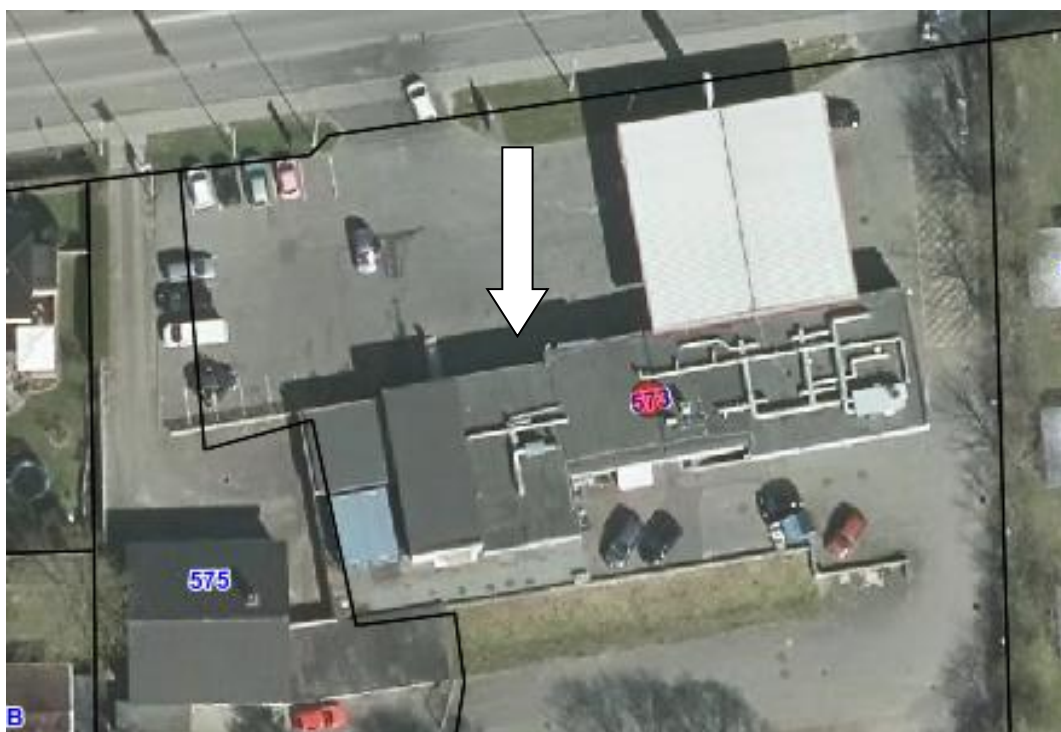
Luftfoto af ejendommen med matrikelskel, anno 2019

I forhold til kommuneplanen ligger virksomheden i område 240604BO, der anvendes til blandet bolig og erhverv. Virksomheden ligger mellem Statoils vaskehal og butik på samme adresse – se indsat pil på nedenstående luftfoto. Virksomhedens areal er ca. 120 m 2 .