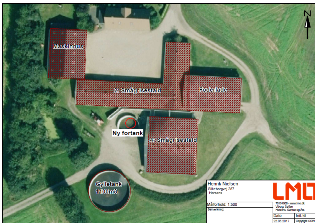
Figur 1: Indretning af ejendommen Silkeborgvej 287, 8700 Horsens. Placeringen af den nye fortank er markeret med rød cirkel.

Kortet herunder viser ejendommens placering og indretning. Det nye anlæg er indtegnet med rød cirkel, og som det ses etableres den nye fortank indenfor rammerne af den eksisterende gylletank, der skal nedrives.