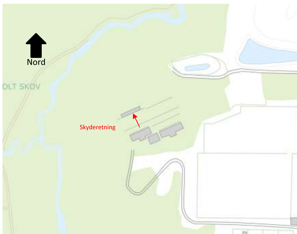
Figur 2. Skyderetning på skydebanen.