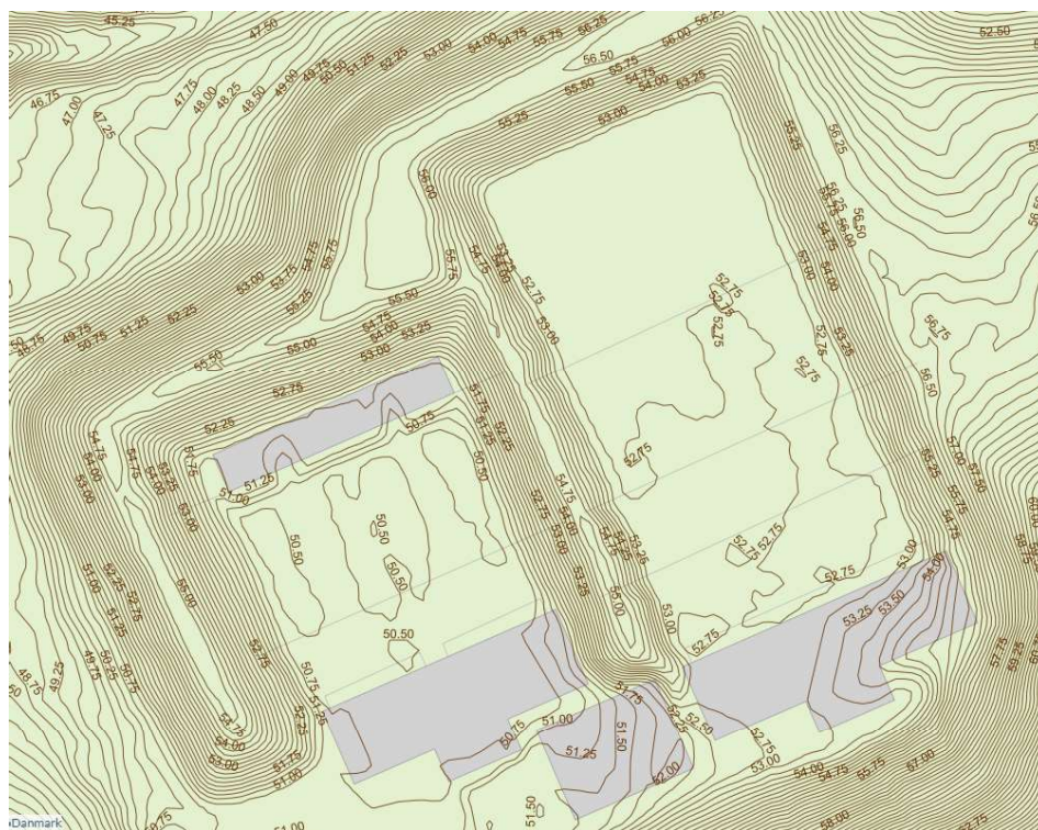
Figur 3. Højdekurver for skydebanen som før en støjvolden imellem 25 meter og 50 meter skydebanerne øges i højden med en meter.