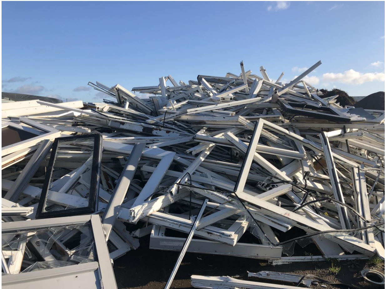
Billede 2. Oplag af PVC vinduer og døre.

Norrdjurs Kommune har efterfølgende undersøgt det nærmere. Produktionen af PVC vinduer blev påbegyndt i 70'erne og man kan således ikke udelukke at de kan være forurenede med PCB.