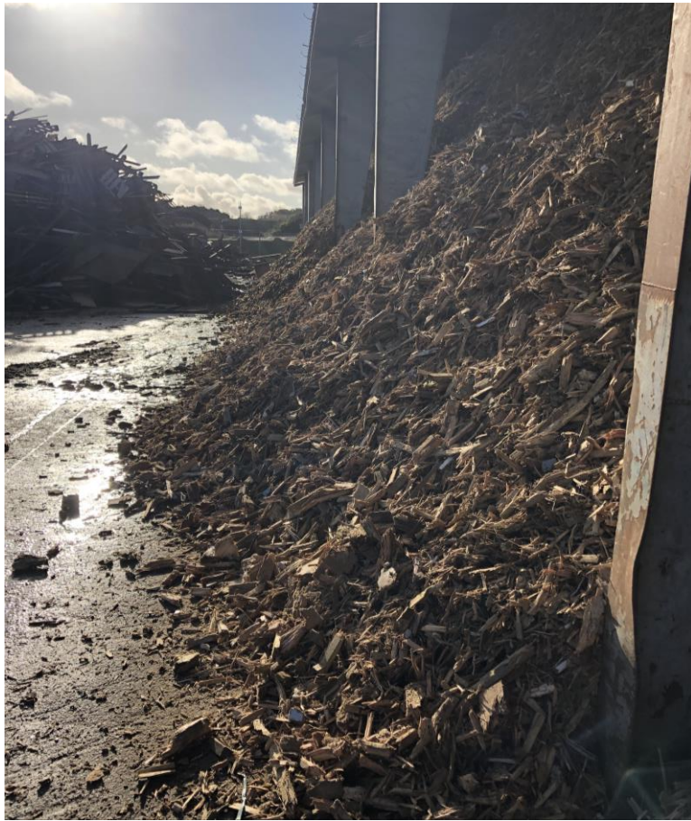
Billede 1. Knust forurenede træ. Oplaget er så stort at det ikke kan holdes under hallens tag.

RGS Nordic oplyste at det nu er faldende mængder (pga. vinterperioden), så de forventer at oplaget snart vil afvikles noget.