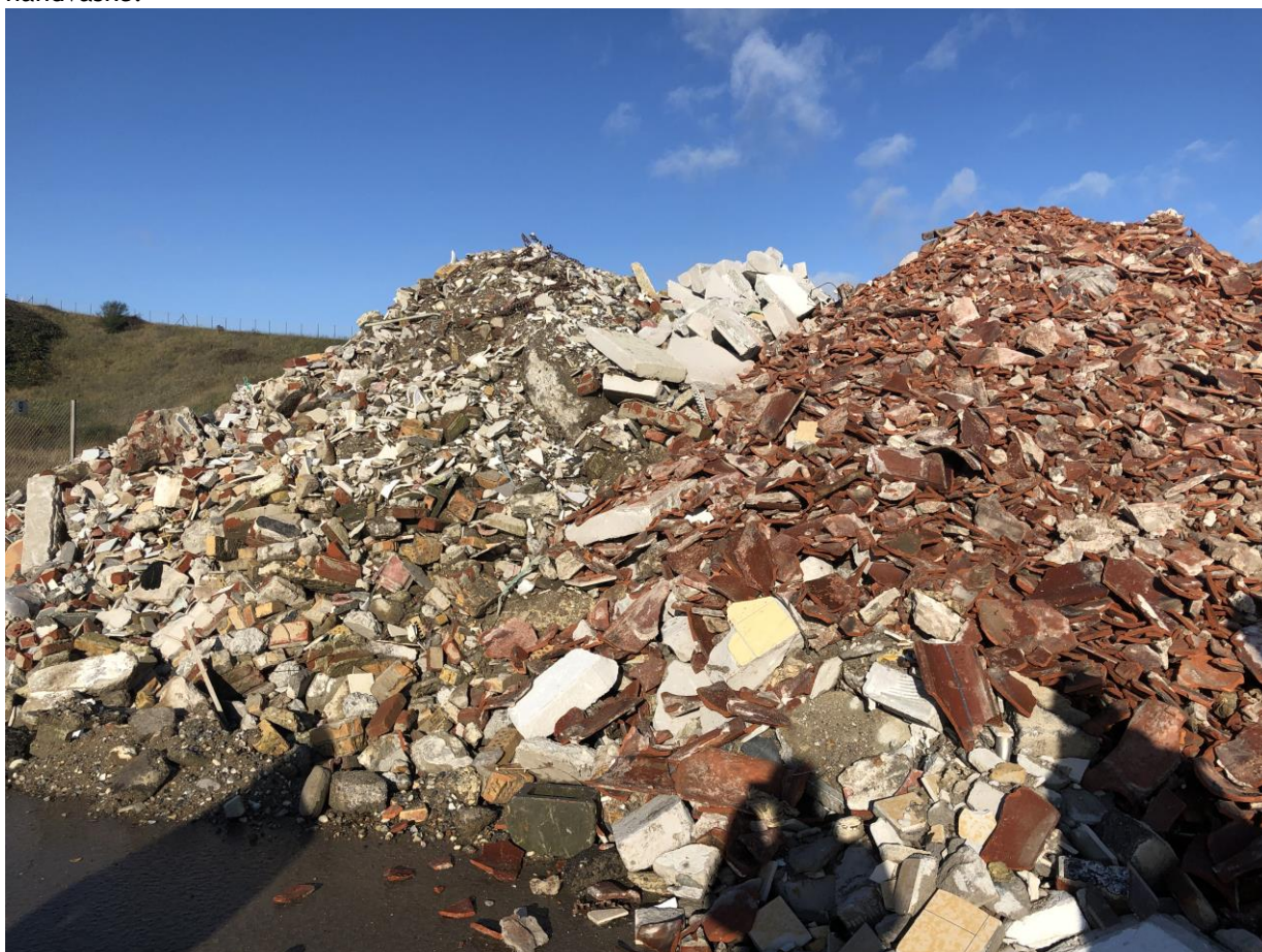
Billede 3. Blandet tegl, herunder glaseret tegl

RGS oplyste at de i samarbejde med Rockwool har lavet deres modtagerkrav. Der er udelukkende tale om visuel vurdering af materialerne. Rockwool modtager kun hvid glaseret sanitet, som fx toiletter og håndvaske.