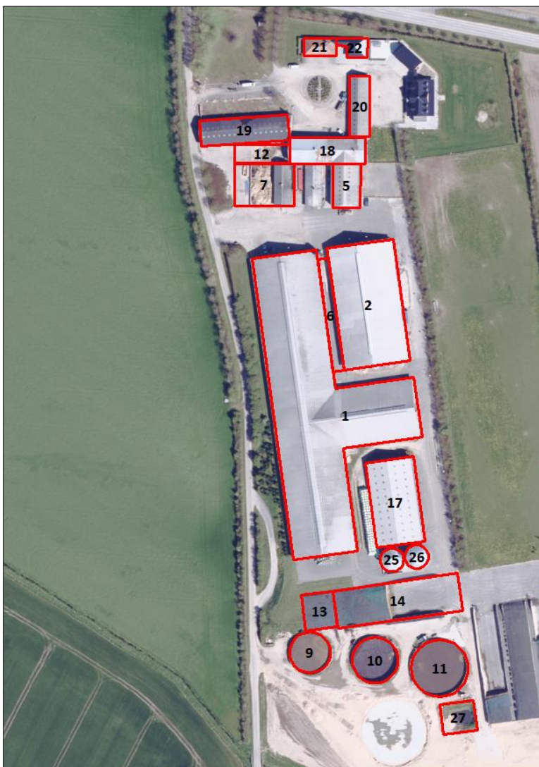
Figur 1. Husdyrbrugets driftsbygninger.