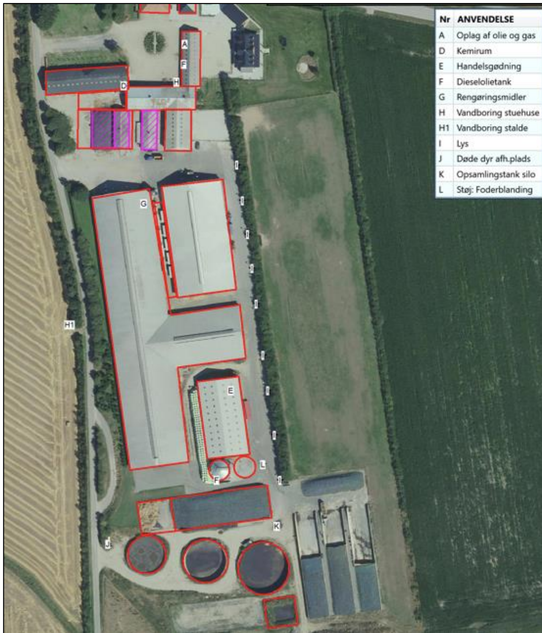
Figur 4. Husdyrbrugets indretning (skraverede bygninger erstattes af ny bygning).

Den eksisterende bygningsmasse er delvist skjult bag eksisterende læhegn på nord, øst og vestsiden af ejendommen, så lyset fra staldene er ikke markant synligt. I forbindelse med fodring i vintermånederne vil der forekomme lys fra traktorprojektører ved råvarelagret og plansilo. Mod syd afsluttes bygningsmassen af de tre gyllebeholdere samt gyllebeholderen der er beliggende på Frømajvej 3. Vejen Kommune stiller vilkår om, at de eksisterende læhegn og beplantninger vedligeholdes, da det både bryder ejendommen og ejendommens lyskilder op, så dette ikke opleves markant i landskabet.