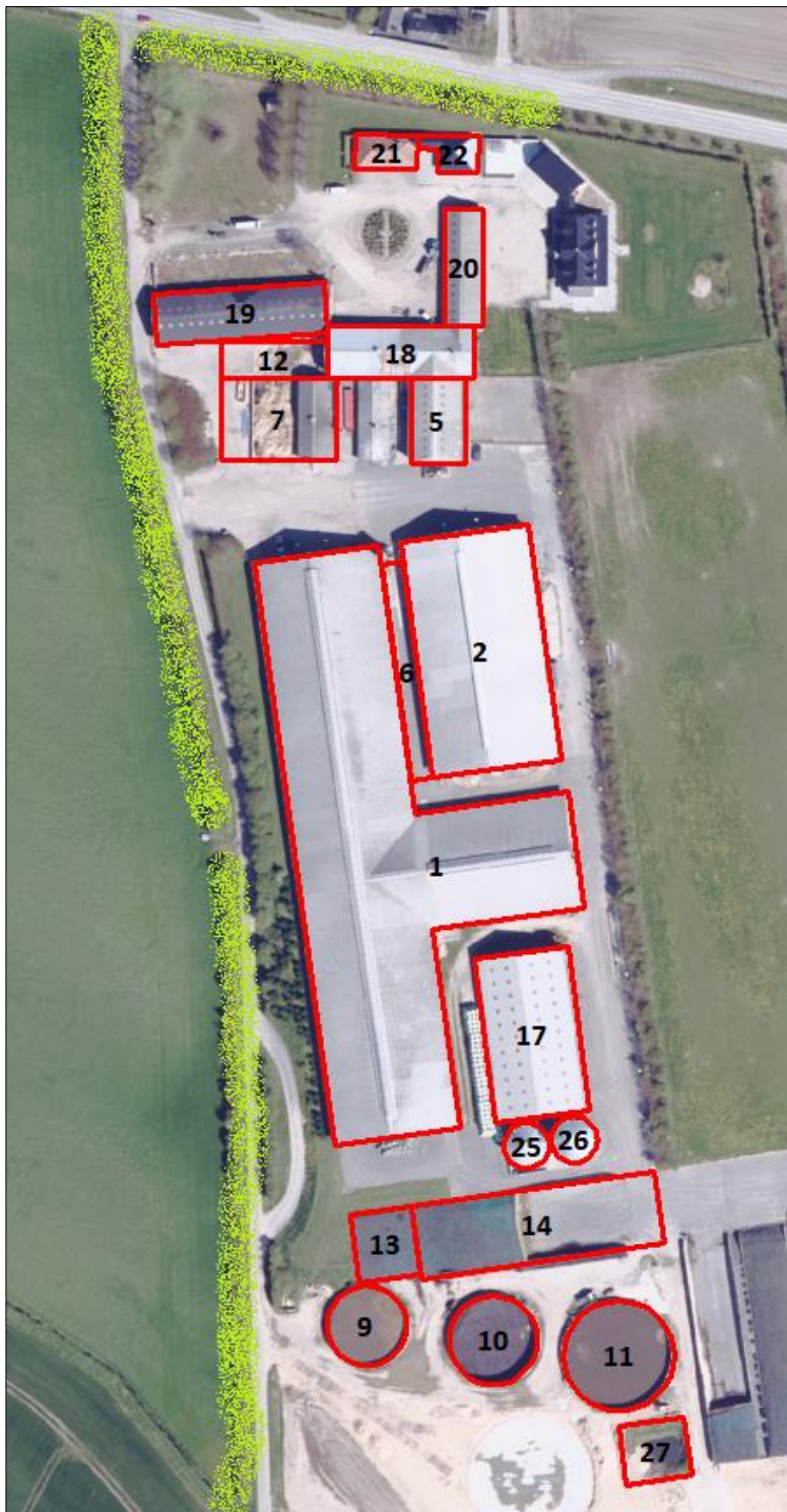
Figur 2. Beplantning der skal bevares (grøn markering).

Ejendommen ligger inden for værdifuldt landbrugsområde, hvor arealanvendelsen til landbrugsformål vægtes højt.