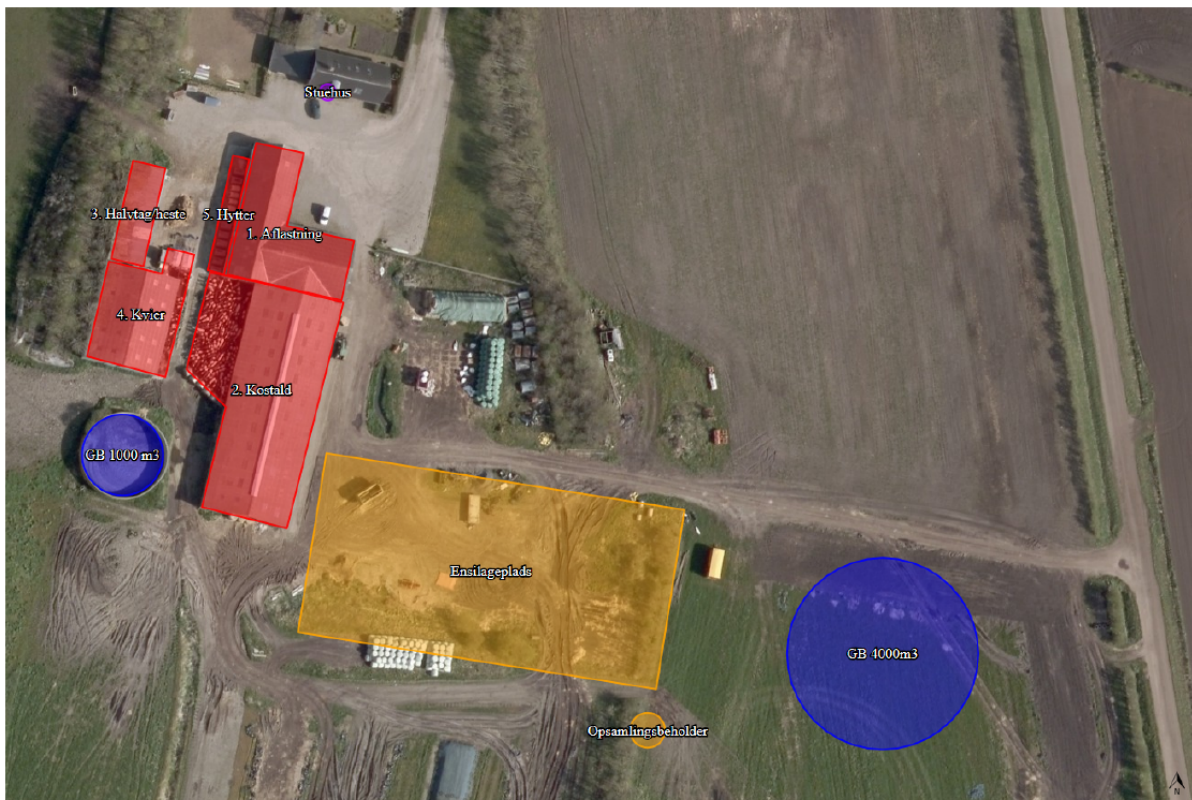
Figur 3: Ansøgers situationsplan