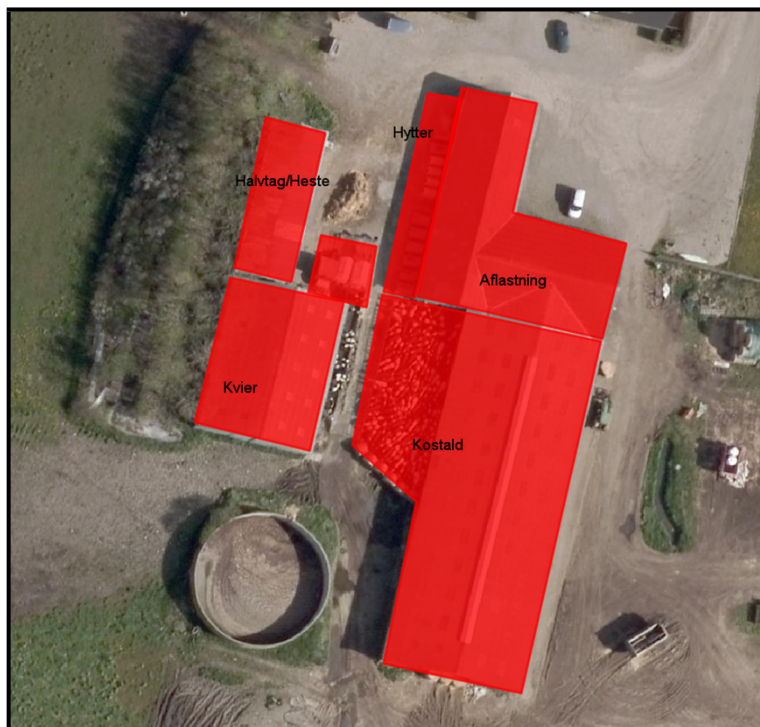
Figur 1 – Situationsplan for staldanlæg.