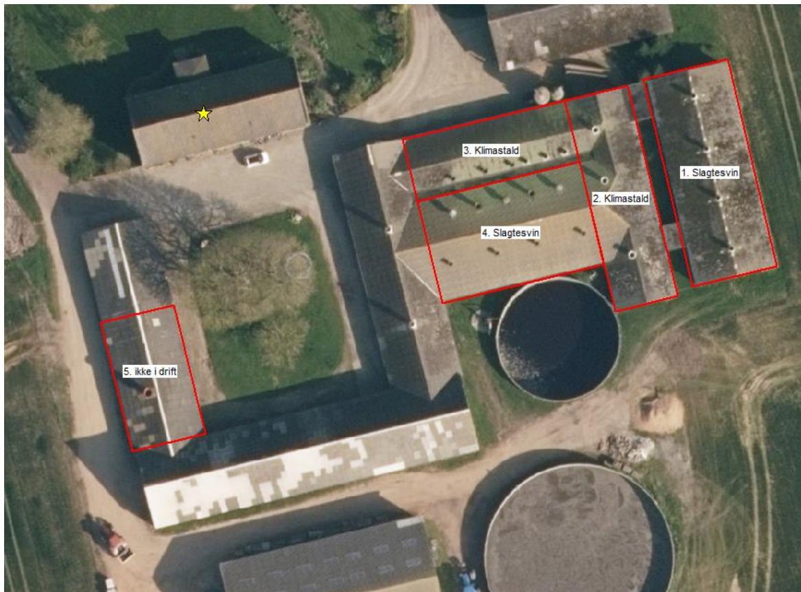
Figur 1. Stalde på Trelde Næsvej 26

På Trelde Næsvej 26 er der anmeldt følgende ændring af dyreholdet: