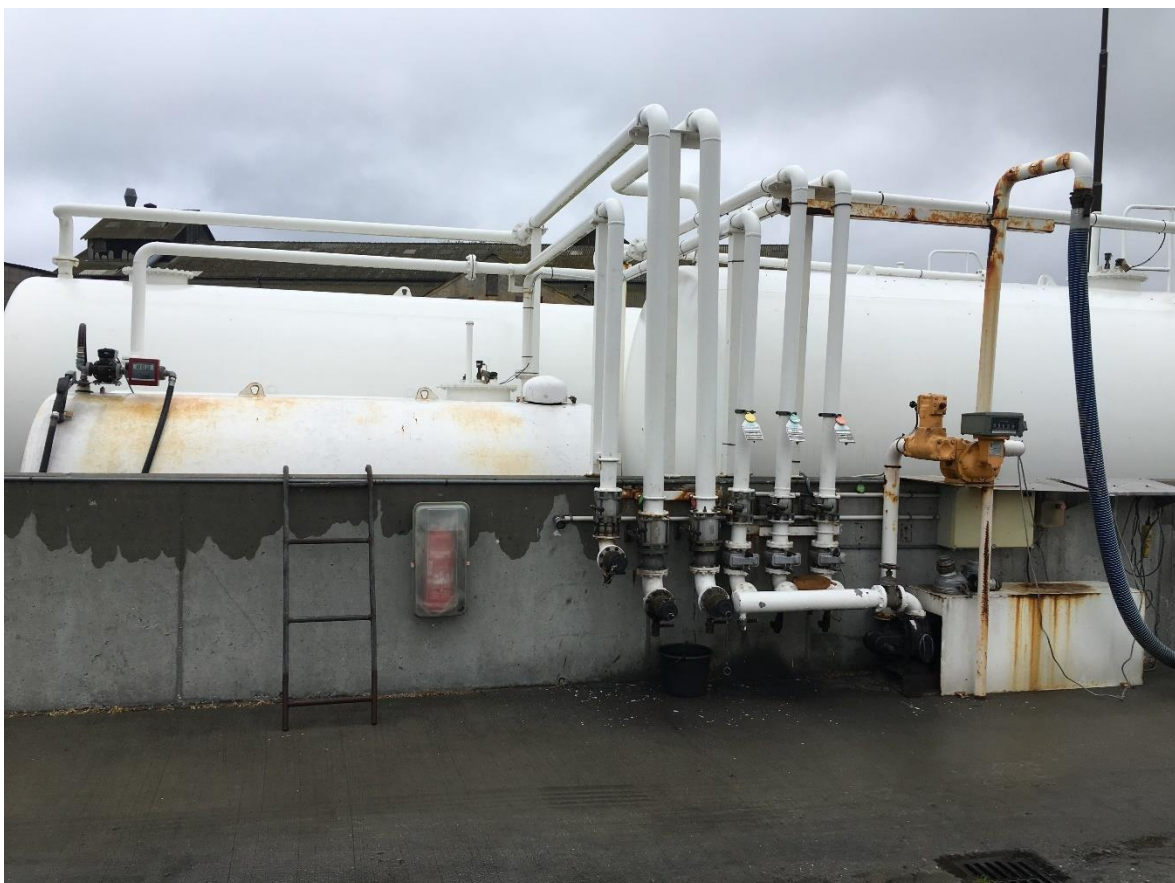
4 tanke i tankgrav er alle i brug.