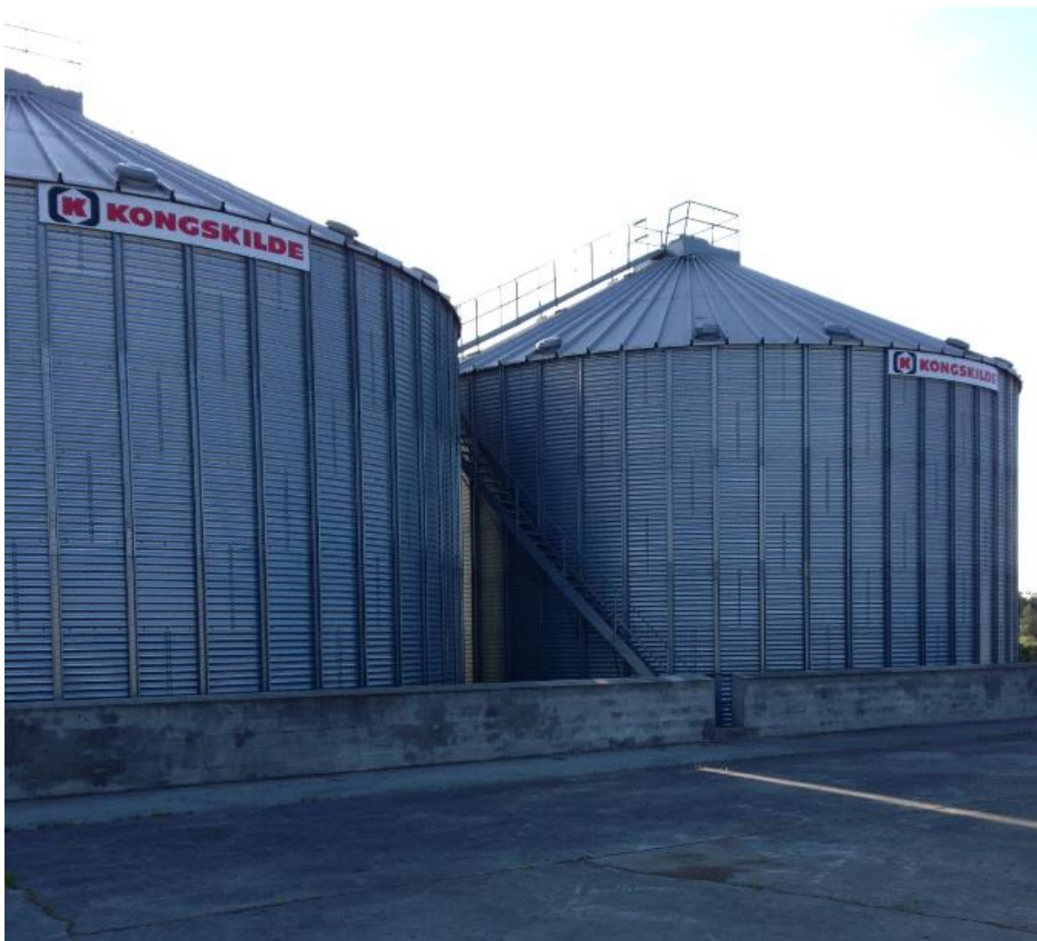
3 nye kornsiloer er opstillet i 2011

Virksomhedens væsentligste støjkloder er ventilationsanlæg til beluftning/tørring samt kørsel/intern transport. Tilsynsmyndigheden har ikke modtaget klager over støj fra virksomheden de seneste år.