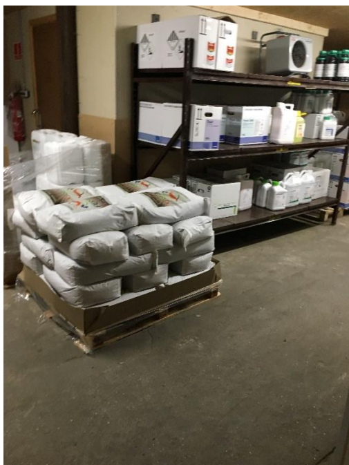
Opbevaring af bekæmpelsesmidler

Bekæmpelsesmidler bliver opbevaret i aflåst rum med fast betonbelægning. Giftskabet i rummet er yderligere aflåst.