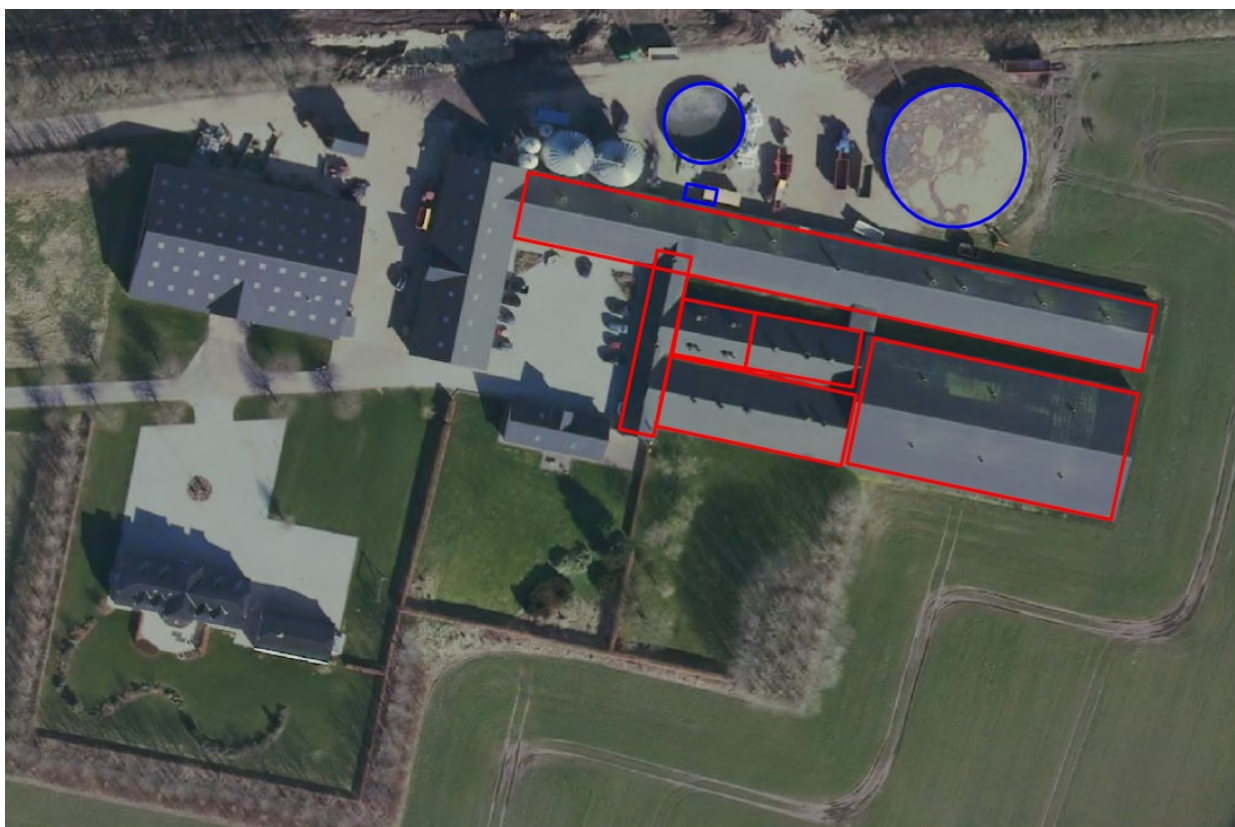
Figur 1: Luffoto 2020 med indtegnning af stalde (rød streg) og gylletanke (blå streg) i revurderingsskemaet.

Du har gennem din konsulent indsendt et revurderingsskema med nr 223057 igennem www.husdyrgodkendelse.dk . Heri er anlægget indtegnet som vist i nedenstående luffoto: