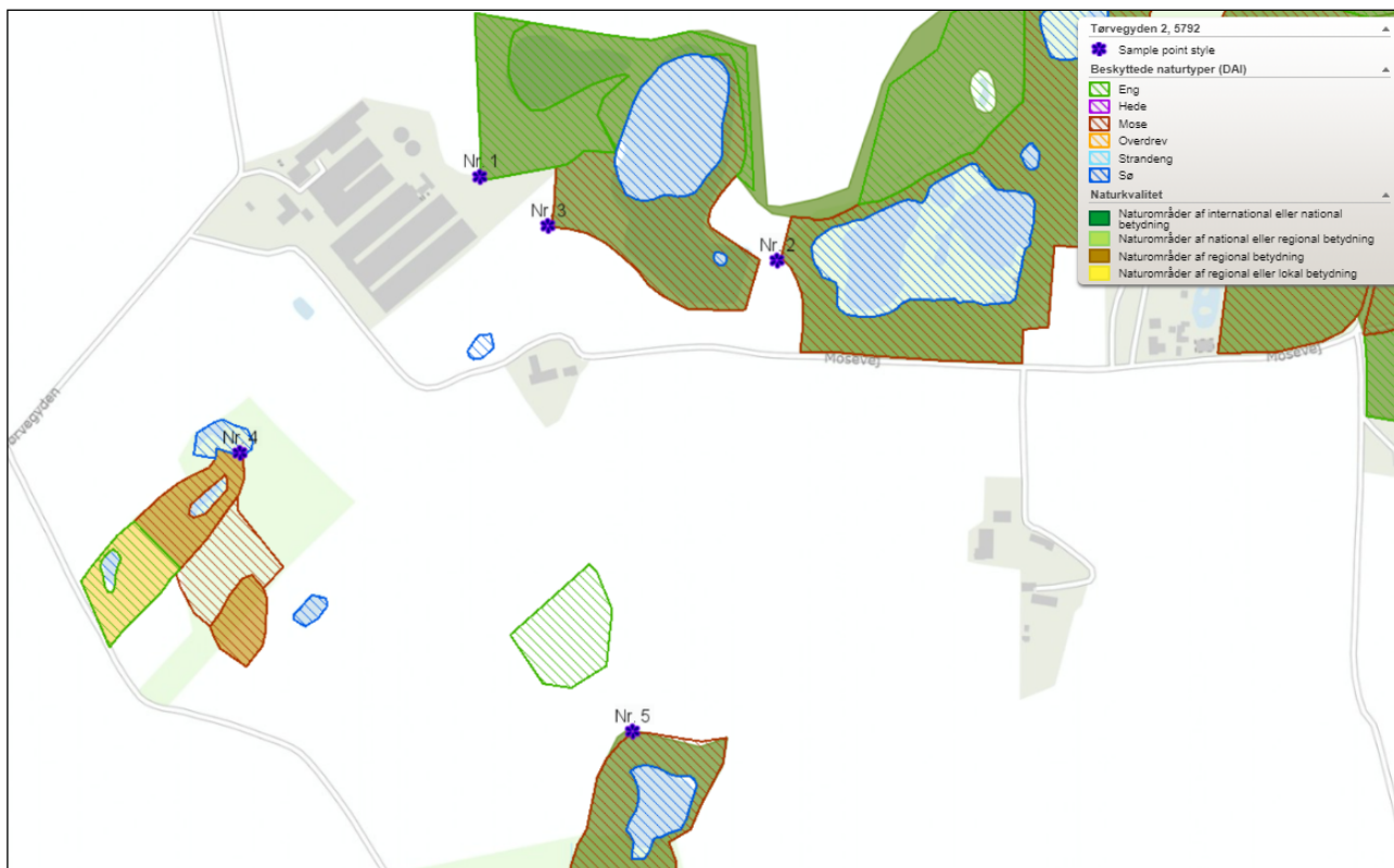
Figur 2: Markering af naturpunkter, hvortil der er lavet ammoniakdepositionsregninger

For den A-målsatte mose ca. 400 m sydøst for ejendommen viser beregningerne i Husdyrgodkendelse.dk (nr. 5 på figur 2) en totaldeposition på 1,4 kg kvælstof/ha/år. Heller ikke her er tålegrænsen overskredet.