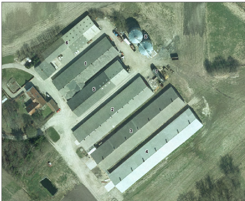
Figur 1. Oversigtskort over husdyrbrugets anlæg, Tørvegyden 2, 5792 Årslev.