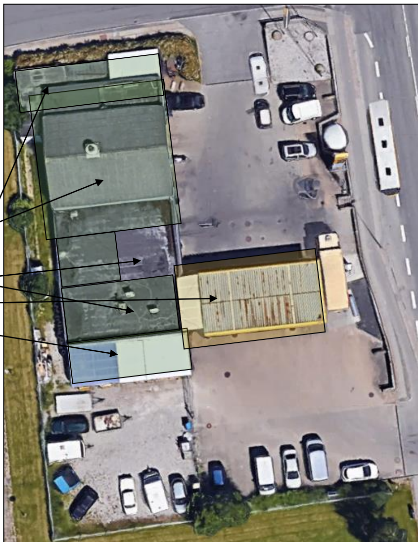
Foto af det store værkstedsafsnit til højre samt mindre værkstedsareal med lift mellem kontor og vaskehal.