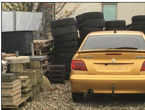
Ovenstående foto af udendørs dæk til aflevering hos Helstrup Dæk.

Ønsker en virksomhed ikke at være tilmeldt, skal den indgå en aftale med en privat renovatør om bortskaffelse af virksomhedens affald.