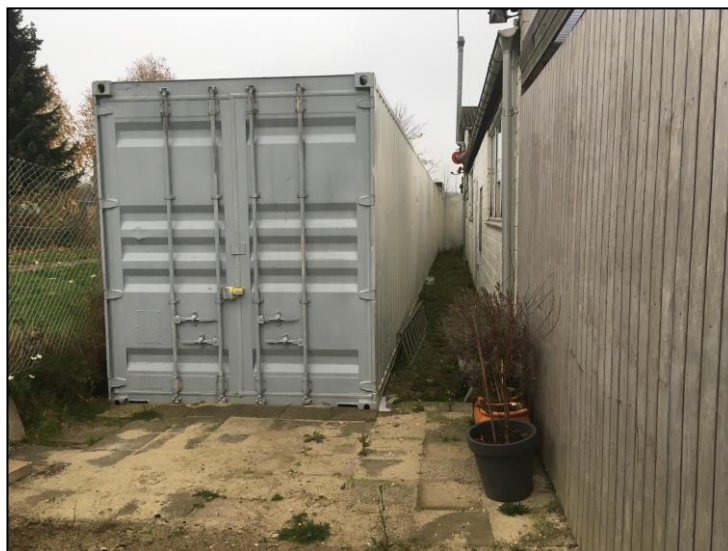
Foto til højre af udendørs opbevaring af materiel i lukket container.

Der er ved tilsynet ikke konstateret jordforurening fra virksomhedens drift.