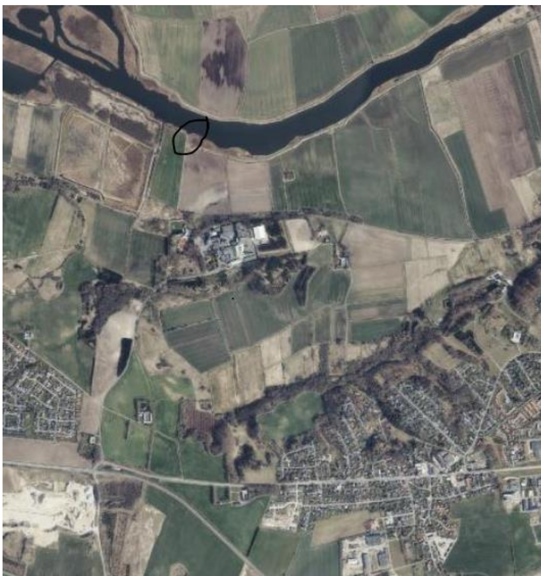
Oversigtskort. Udledningspunktet er markeret med cirkel.