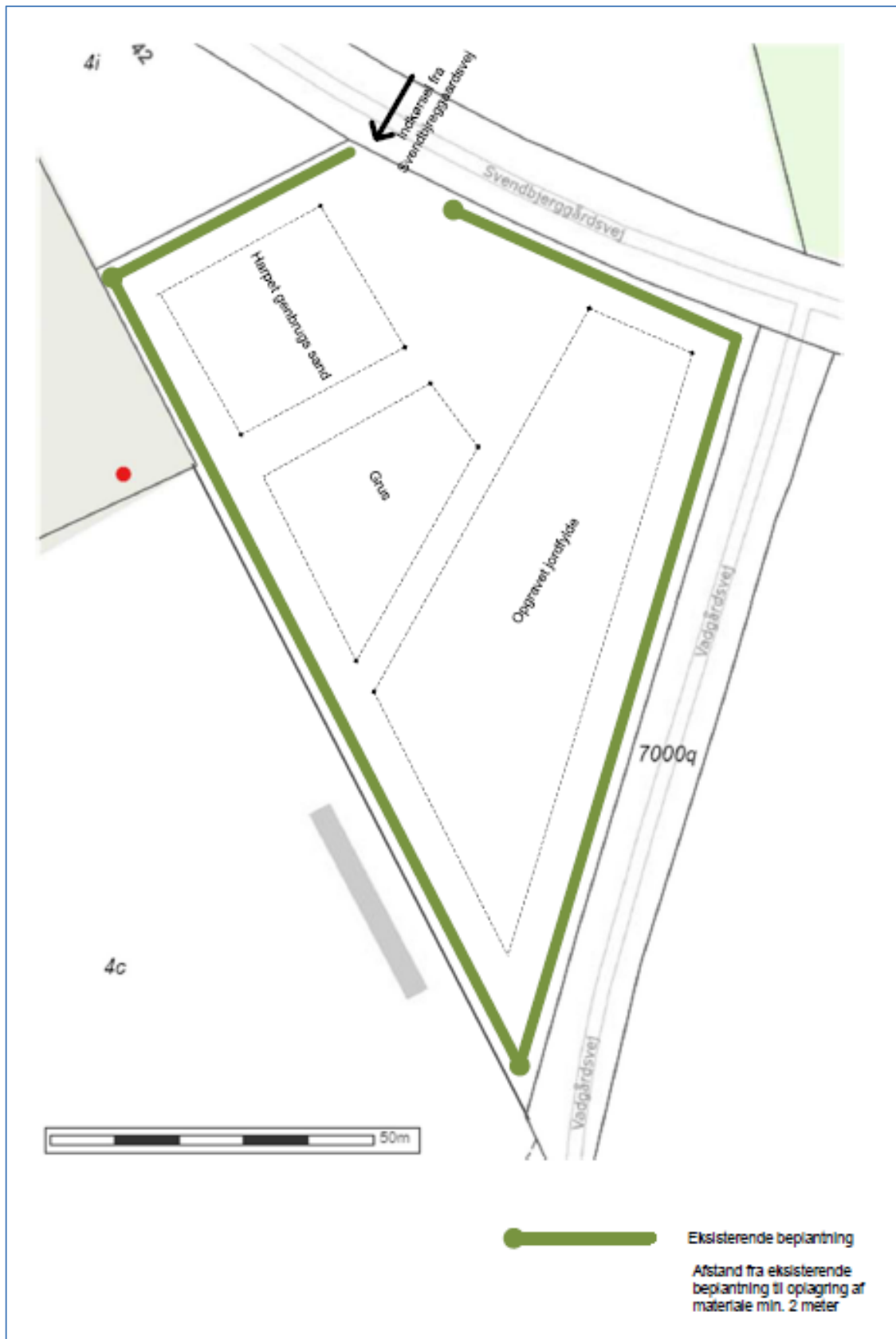
Plan for indretning af Vadværdsvej 12