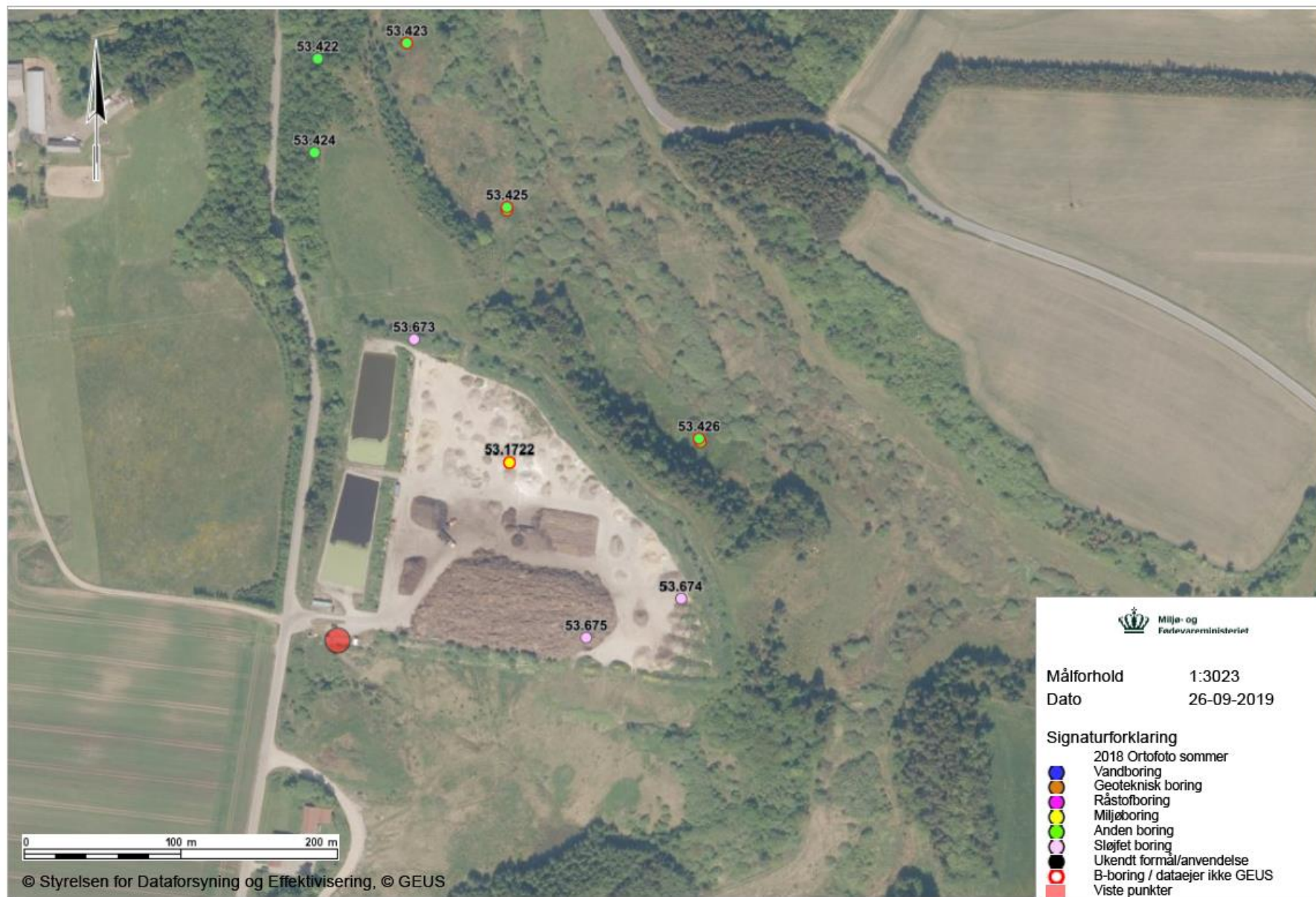
Figur 1 Boring KII med DGU nr. 53.427 ligger bag boring 7 med DGU nr. 53.425 og boring KIII med DGU.nummer 53.328 ligger bag boring 8 med DGU nr. 53.426 og kan derfor ikke ses på kortet