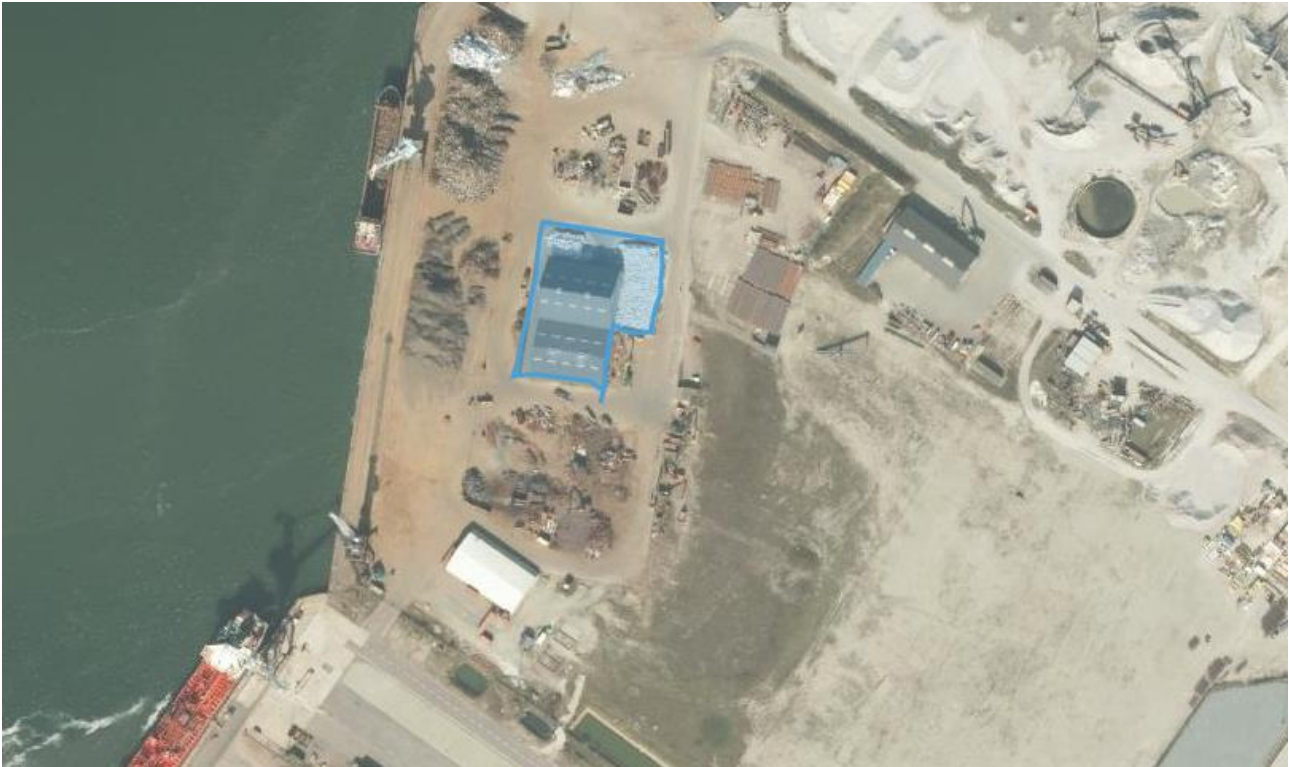
Figur 1. Placering af den del som nærværende miljøgodkendelse

Placeringen af Agro Trade på Lindø-havnen er som vist i Figur 1, hvor det lejede areal udgør ca. 2.800 m 2 .