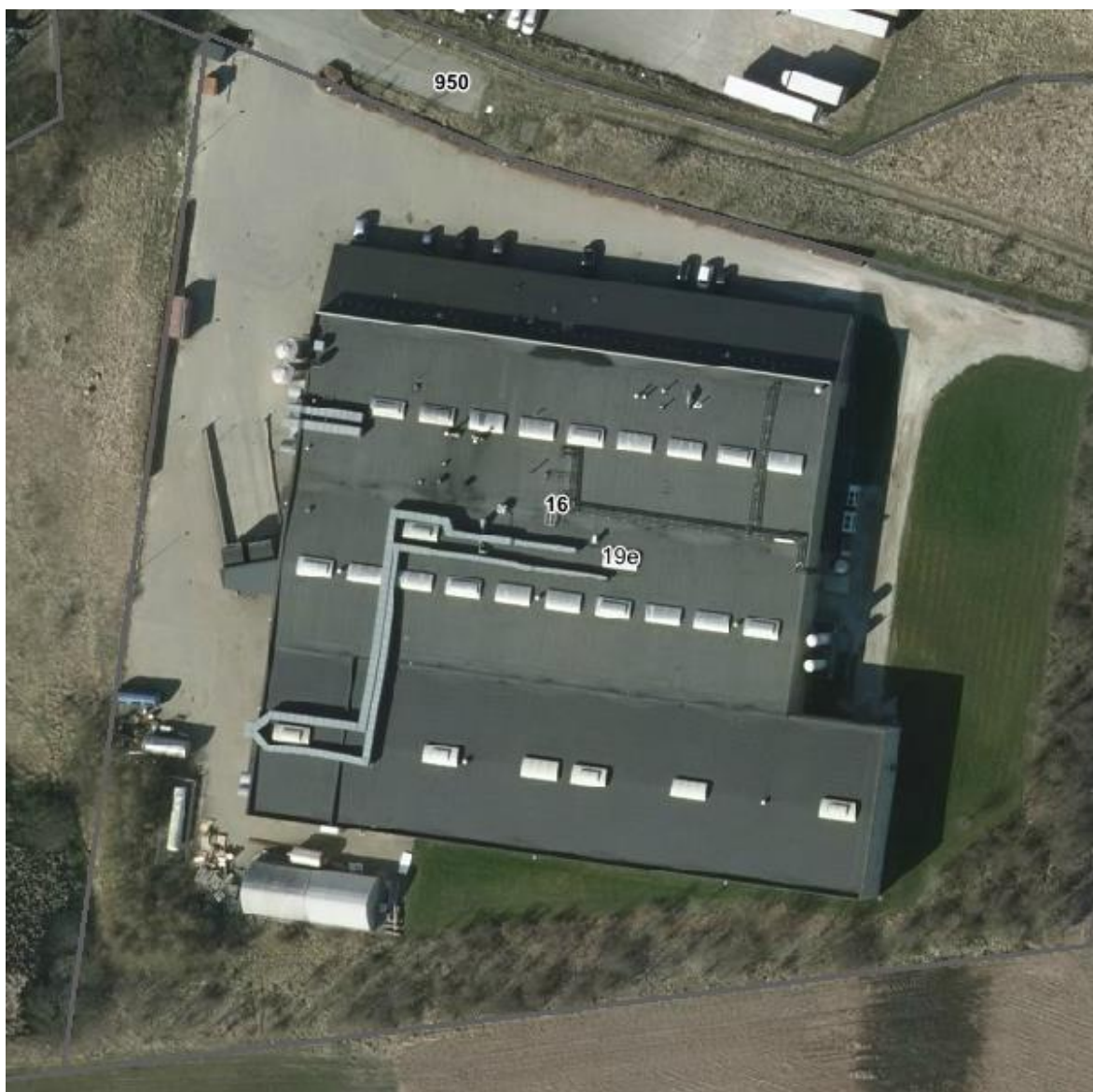
Luftfoto af virksomheden med matrikelskel anno 2016

I forhold til kommuneplanen ligger virksomheden i område 250308ER, der er udlagt til erhvervsformål. Området er omfattet af lokalplan 352. Nærmeste bolig ligger i det åbne land ca. 65 meter mod sydvest.