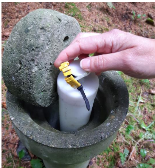
Billede 4. Boring, DGU nr. 70.690.