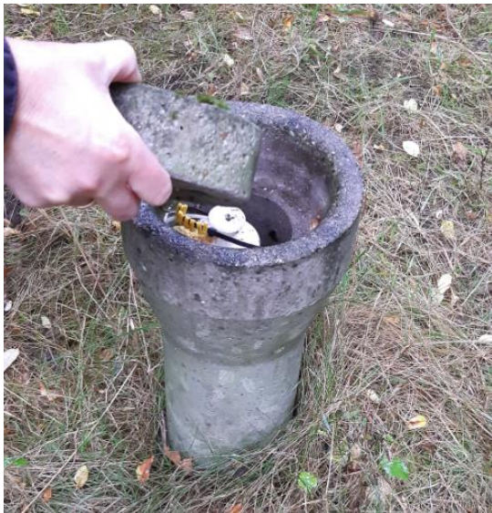
Billede 3. Boring, DGU nr. 70.689.