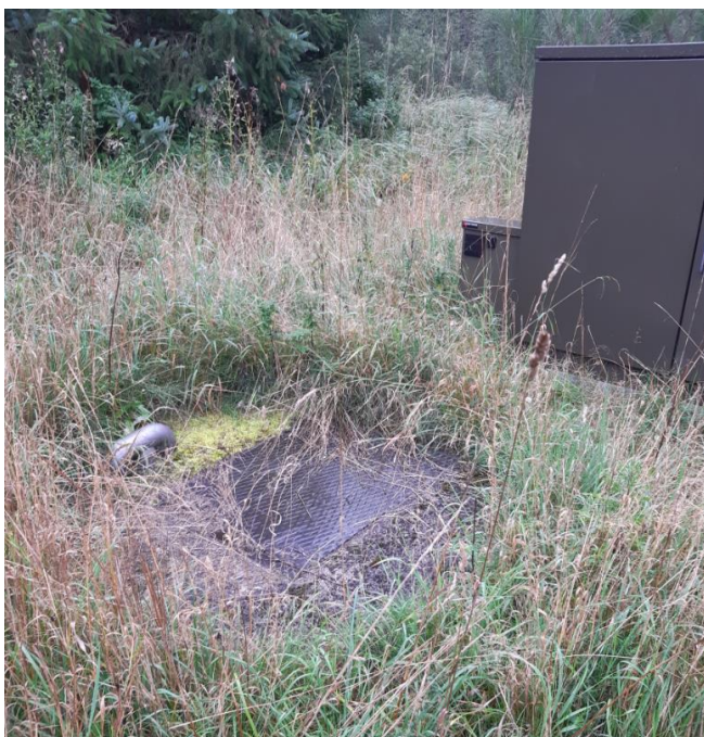
Billede 1. Pumpestation til perkolat.

Miljøstyrelsen har besøgt alle monitoringsboringer i forbindelse med miljøtilsynet i 2018. Enkelte boringer blev besøgt ved dette tilsyn.