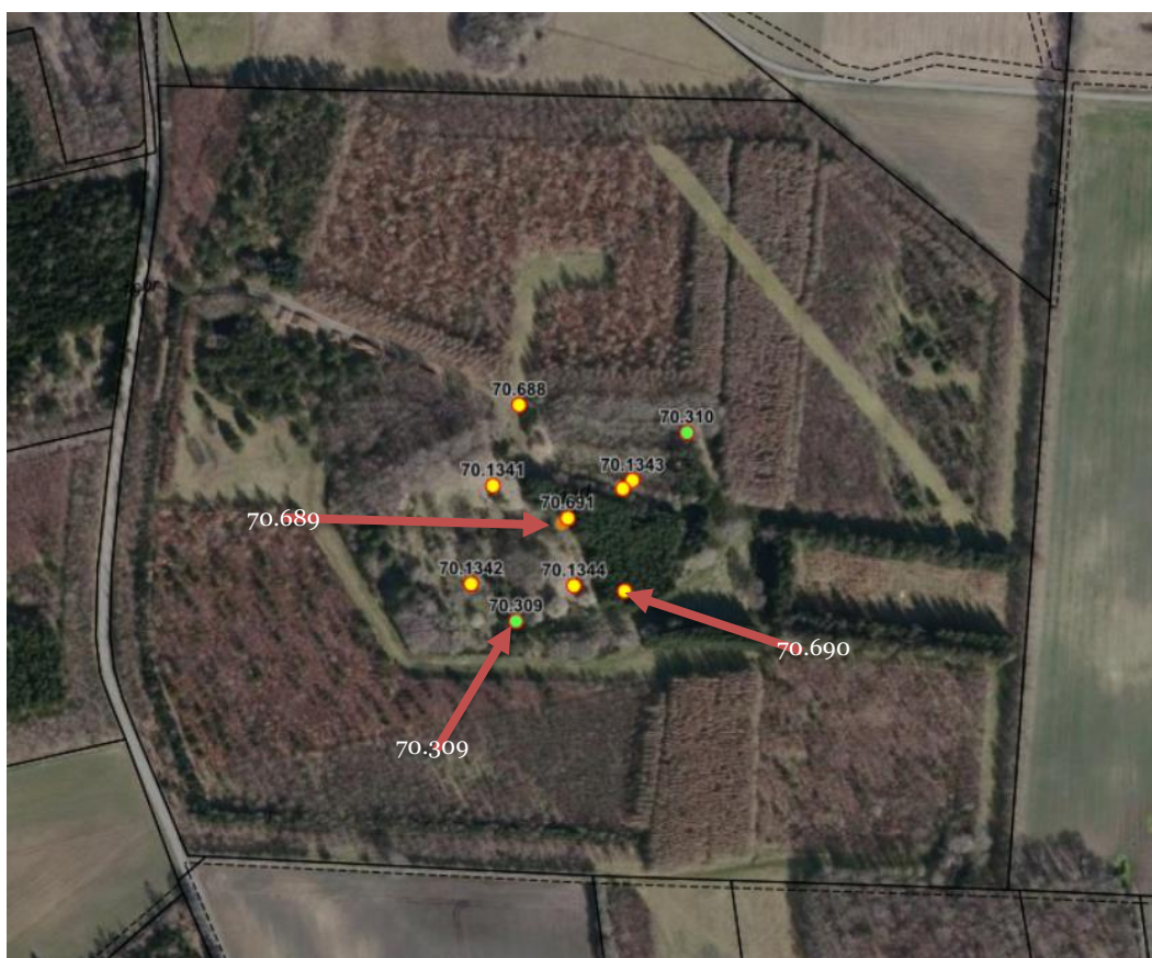
Billede 2. Luftfoto 2021. DGU-nummerering af boringer i området. De markerede boringer blev besøgt på tilsynet.

Miljøstyrelsen har besøgt alle monitoringsboringer i forbindelse med miljøtilsynet i 2018. Enkelte boringer blev besøgt ved dette tilsyn.