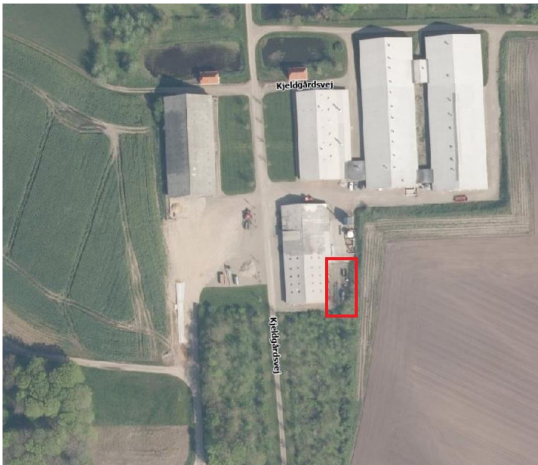
Kort 1: Placering af nyt maskinhus på 585 m 2 på Kjeldgårdsvej 9