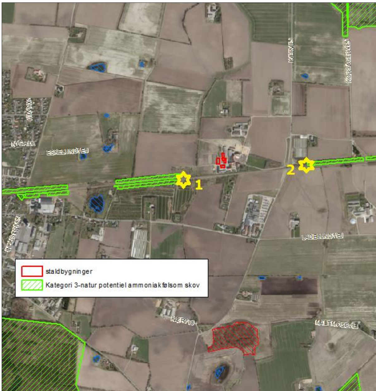
Figur 3. Kort over kategori 3 natur ved anlægget.