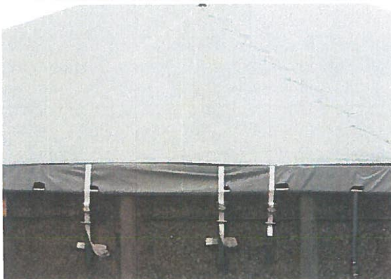
Rustfrie opstamninger sikrer lang holdbarhed