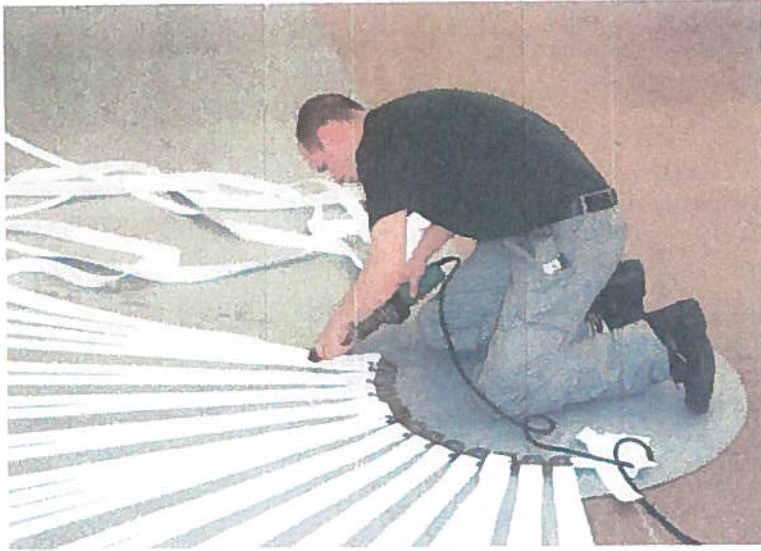
Produktion af Agro-Top overdækning