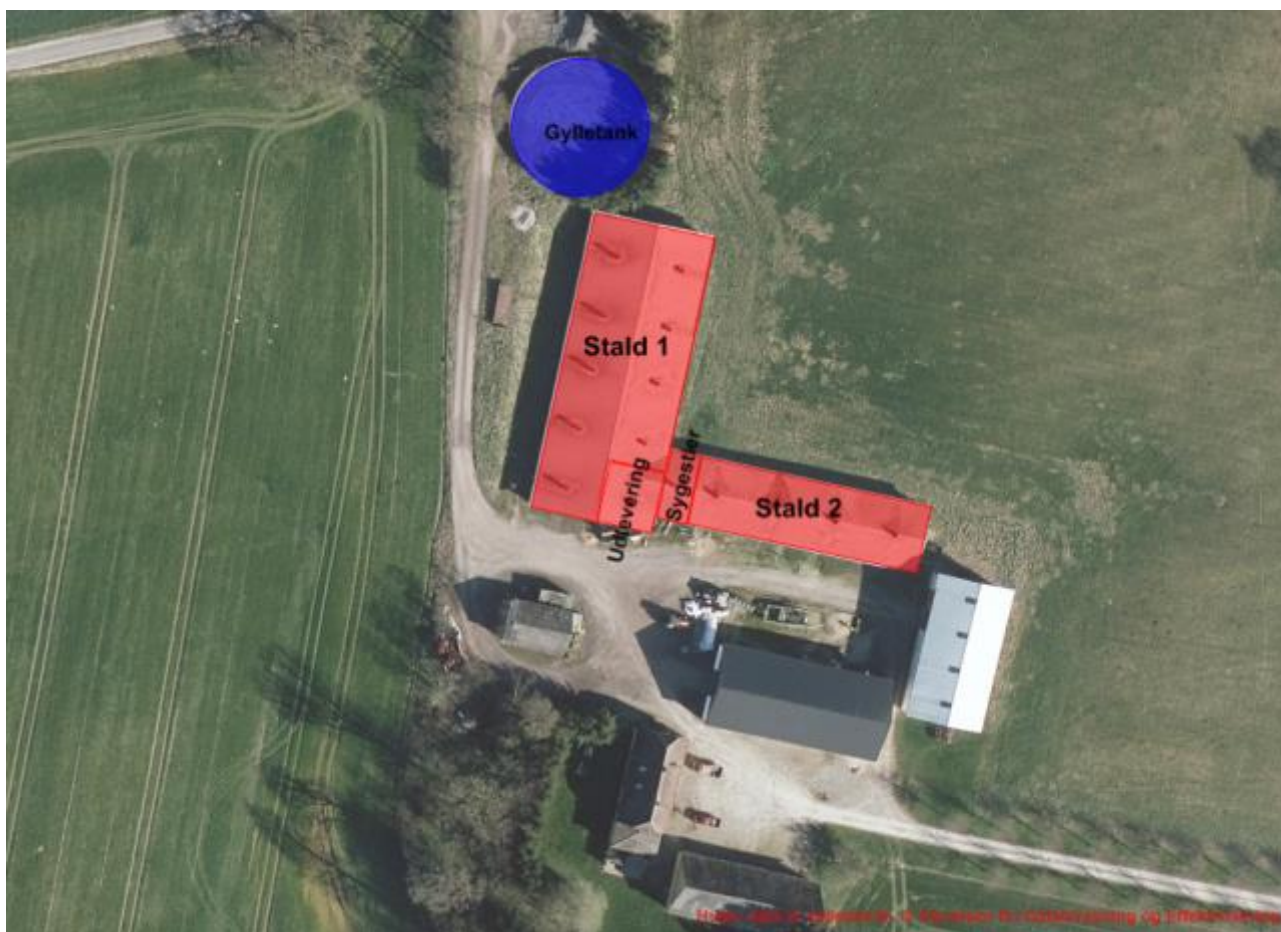
Figur 1 – Anlægstegning. Staldafsnit markeret med rød, gyllebeholder markeret med blå.

Det samlede vejledende ammoniaktab pr. år opnåeligt for hele anlægget ved anvendelsen af BAT bliver 2.412 kg N/år, og det faktiske ammoniaktab fra hele anlægget ved anvendelsen af BAT bliver 2.412 kg N/år. Ammoniakniveauet for den ansøgte produktion er dermed ikke højere end den vejledende BAT emission.