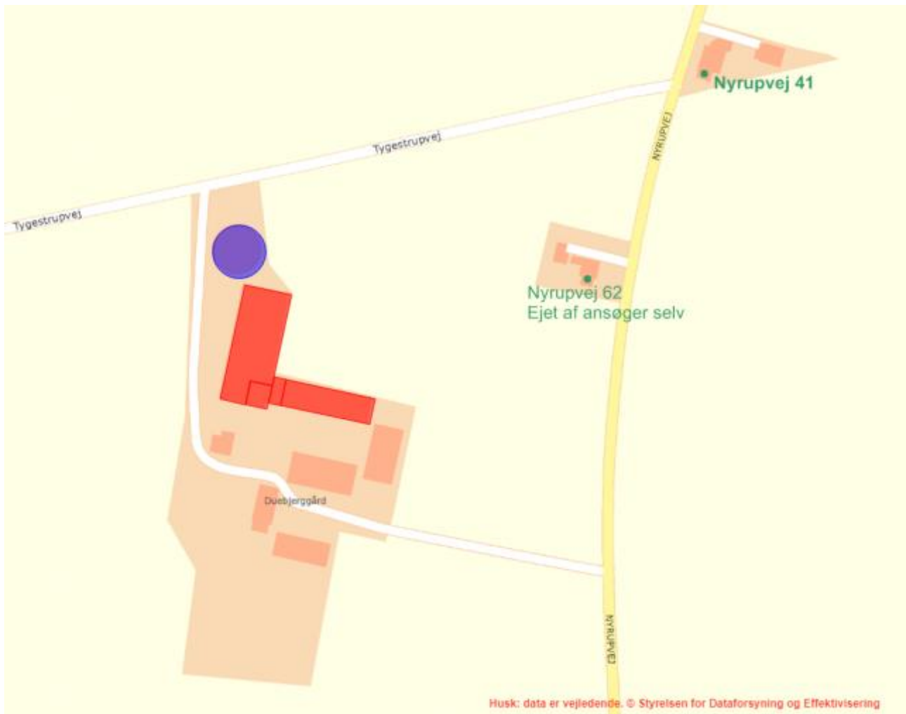
Figur 3 – Nærmeste nabo til husdyrbruget (uden landbrugspligt) er Nyrupvej 41. Nyrupvej 62 er ejet af ansøger selv og skal derfor ikke medtages i lugtberegningen.

Som det ses af tabellen ovenfor, overholder den ansøgte produktion lovens minimumkrav til lugtgenæfstande til de forskellige typer af beboelser i området.