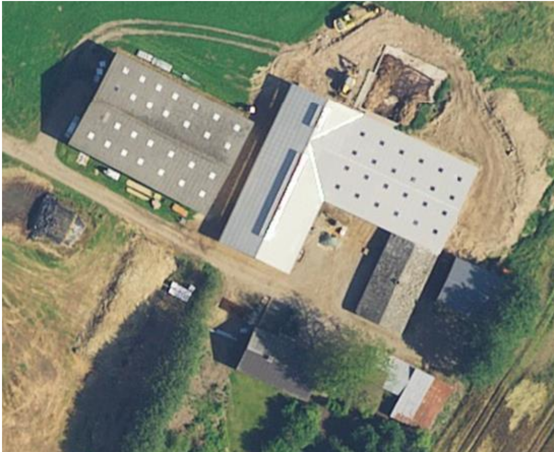
Figur 2. Ejendommens indretning efter svinestalden er færdigopført.