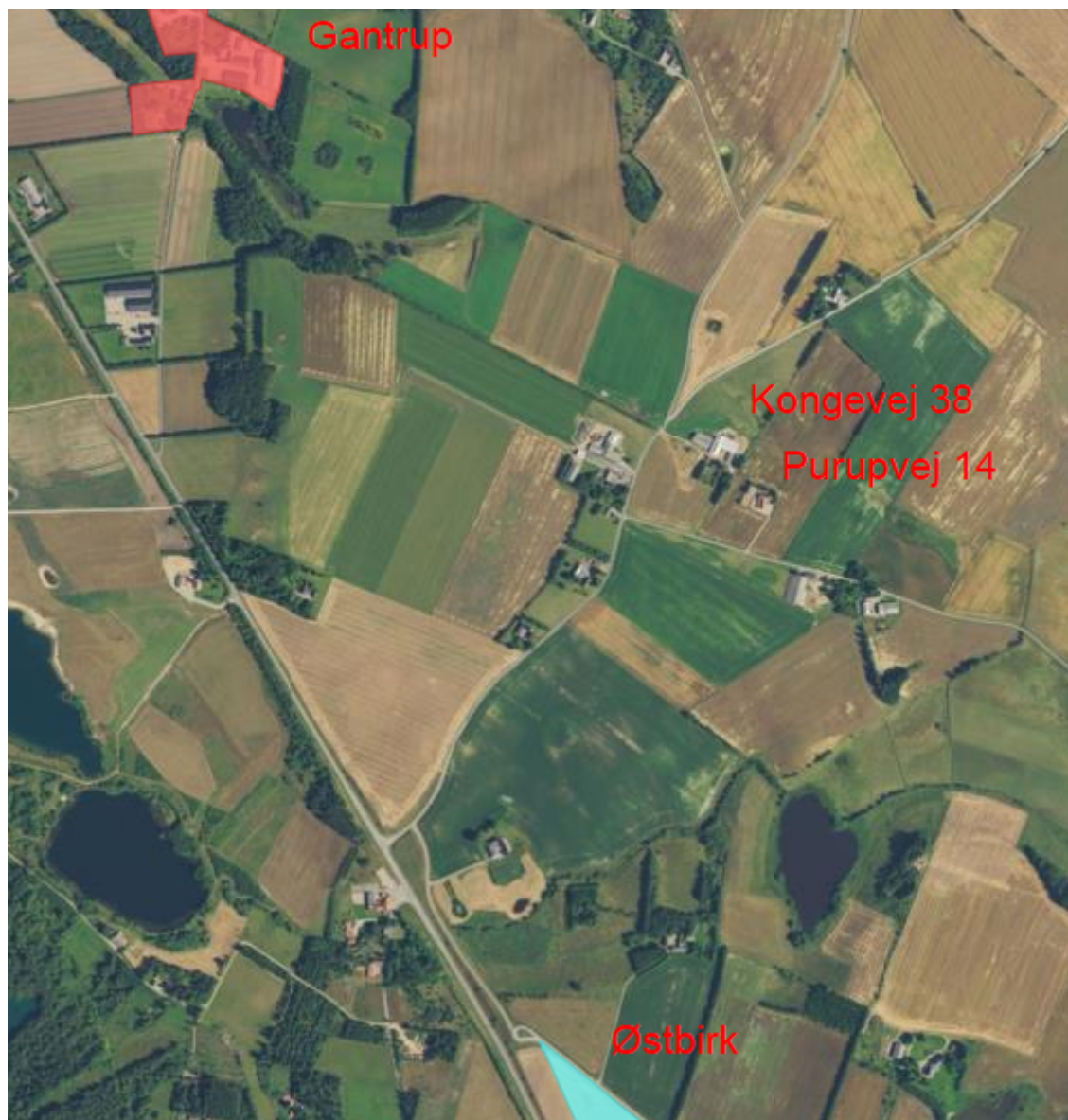
Figur 3. Beliggenhed af nærmeste nabo, samlet bebyggelse (Gantrup) og byzone (Østbirk)

Der etableres ikke udendørs lys ved den nye stald og der vil derfor ikke være gener her fra.