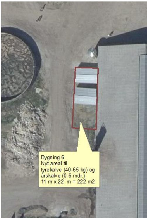
Figur 2. Nyt areal til kalve.