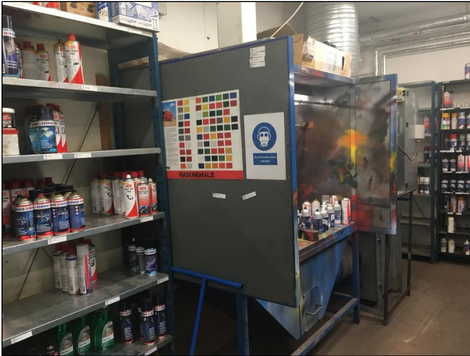
Foto af del af værksted på Vi-engevej: malerafsnit med udsugning. Der anvendes kun spraydåser