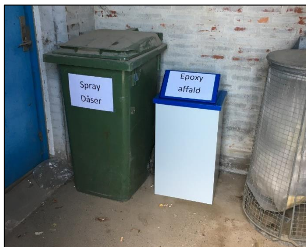
Lokal affaldssortering på Norddagesvej

Det skal bemærkes, at der kan forudprintes kvitteringsskrivelser til underskrift på modtagestationen, når virksomheden afleverer sit affald.