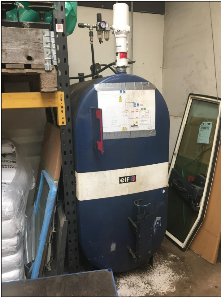
Motorolietank indendørs på lageret på Viengevej