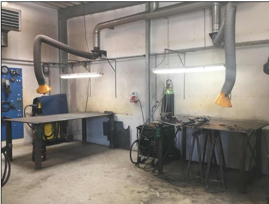
Foto af del af værksted på Vi-engevej: metalbearbejdende afdeling med udsugning.