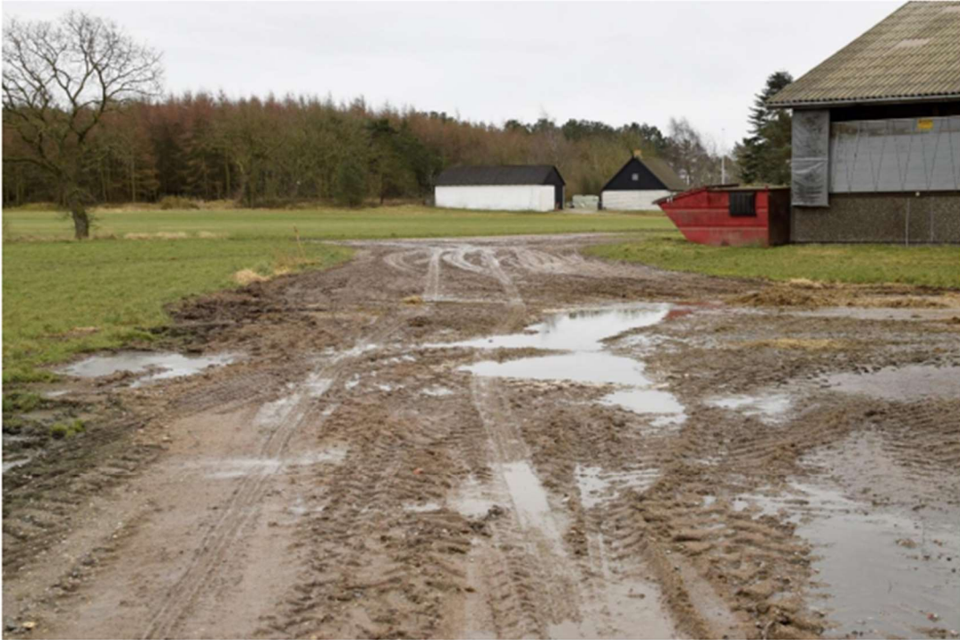
Der ses omfattende skader på begge sider af vejen