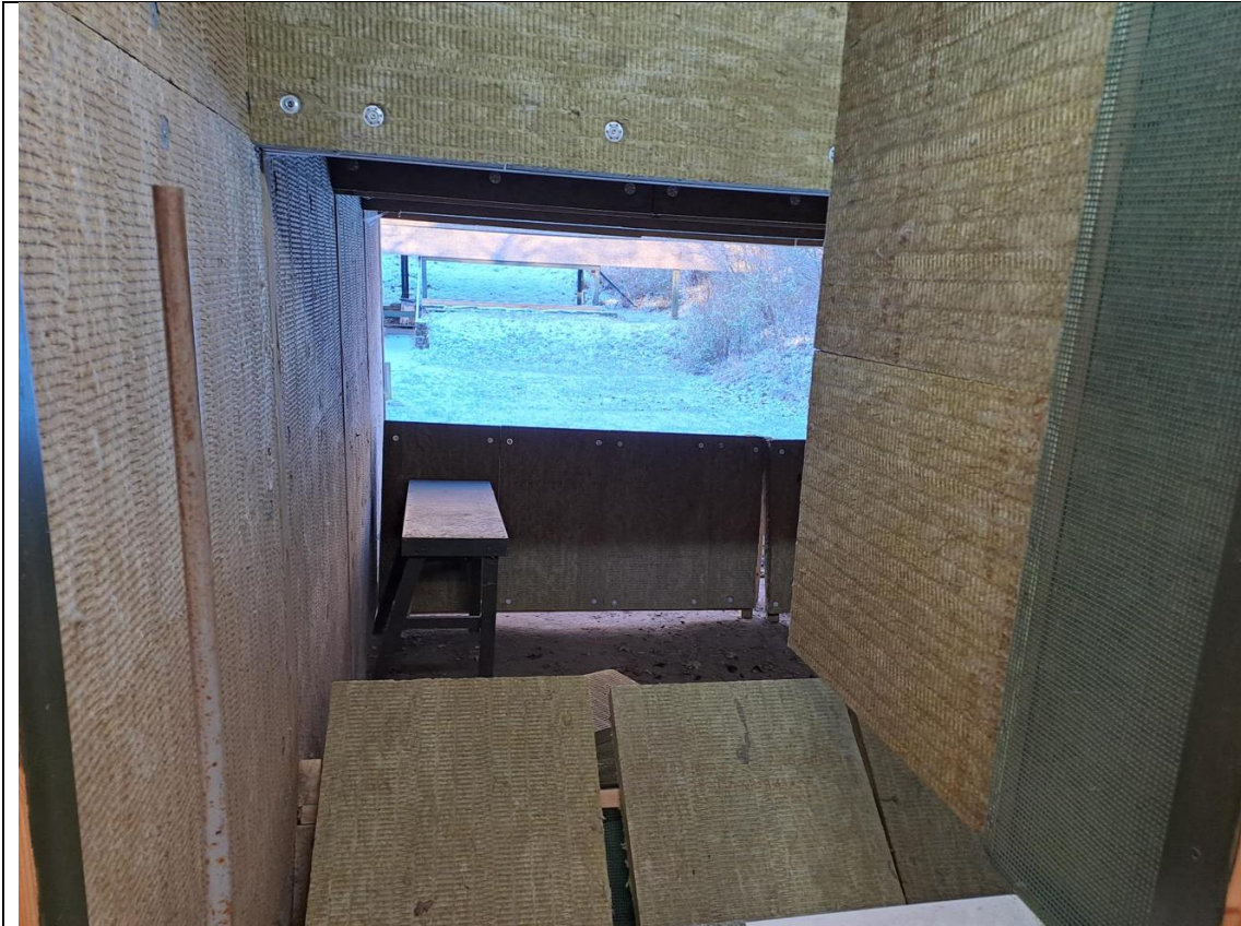
Foto2 Støjdæmpning af standplads på 50 meter banen