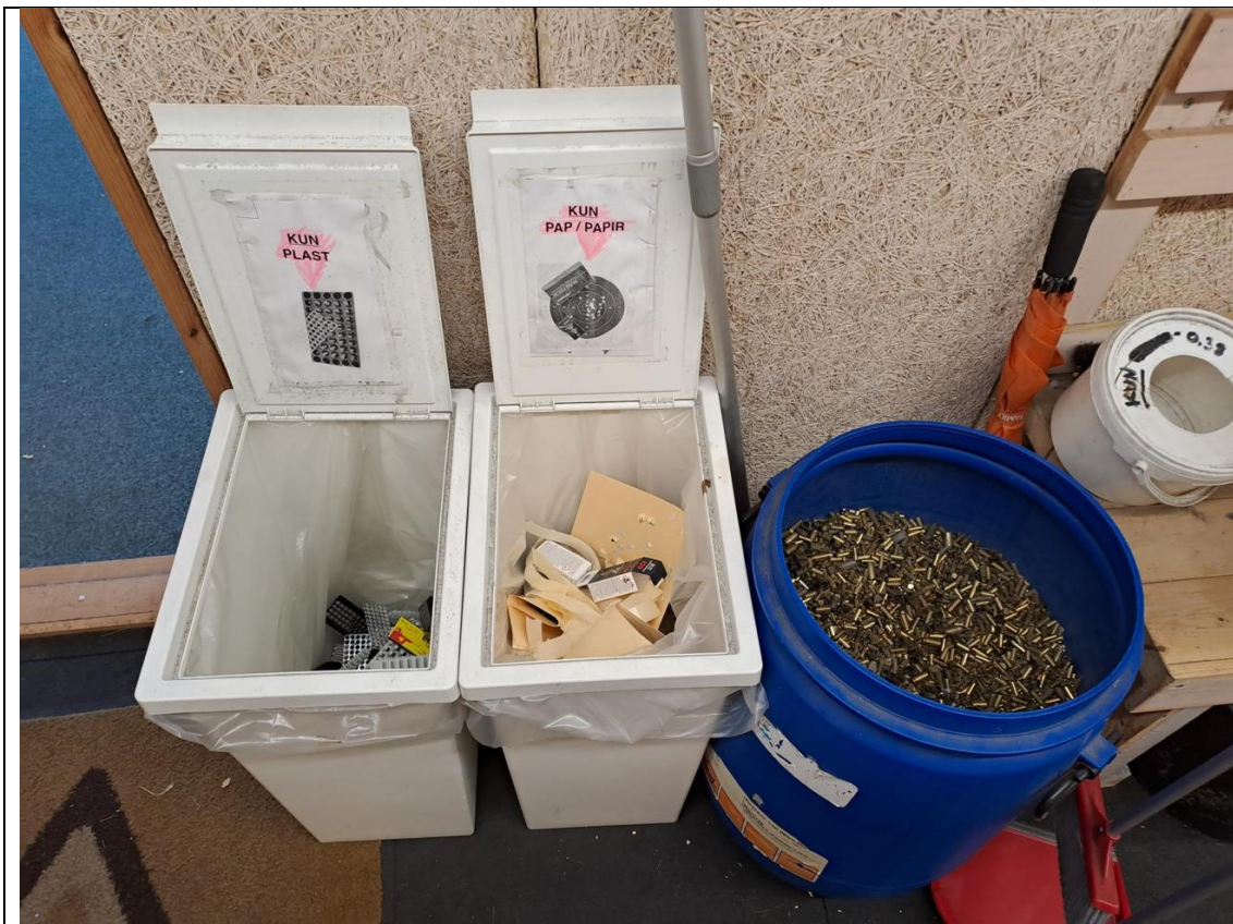
Foto 1 affaldssortering