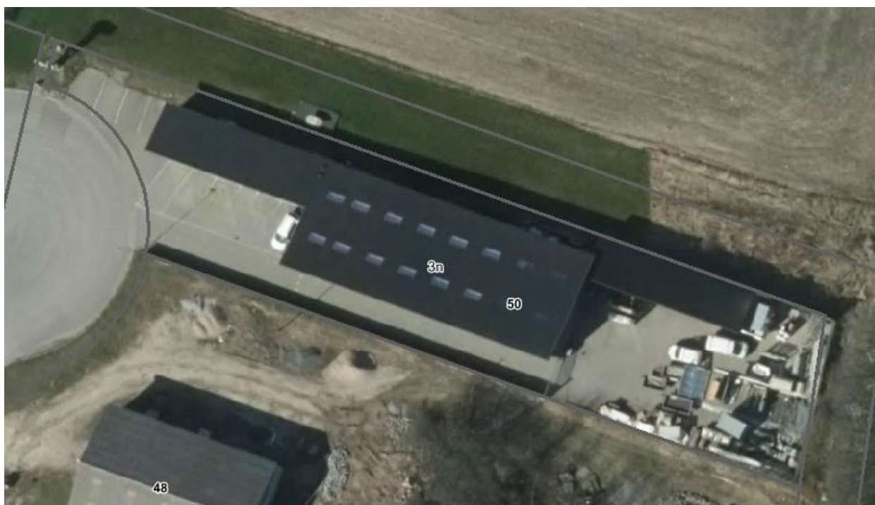
Luftfoto af virksomheden med matrikelskel, anno 2016

I forhold til kommuneplanen ligger virksomheden i område 250308ER. Området er udlagt til virksomheder i klasse 2-5. Virksomheden tilhører klasse 5.