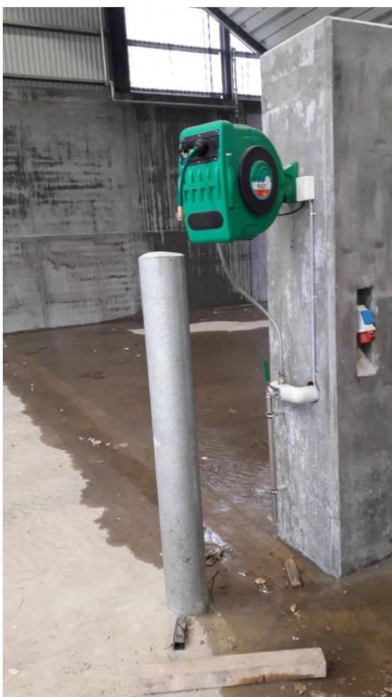
Figur 2 Der er vandslanger langs plansiloerne og afløbsriste, så det er muligt at udføre den påkrævede rengøring af siloerne.