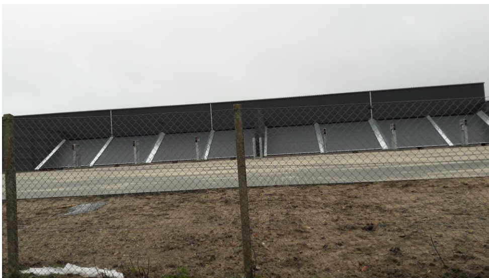
Figur 1 Anlægget set udefra. Arealet er indhegnet. Lastbilerne kan bakke til lågen hvorefter den åbner automatisk, og det er muligt at aflæsse ned i plansiloerne bag ved lågerne. Lågerne lukker automatisk umiddelbart efter at lastbilerne kører igen.