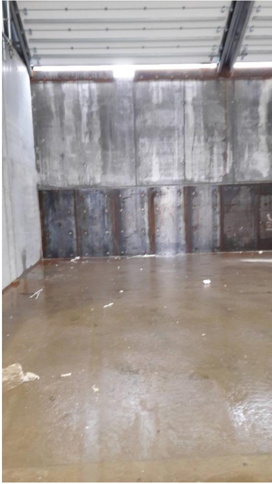
Figur 3 En plansilo, hvor porten kan ses for oven.