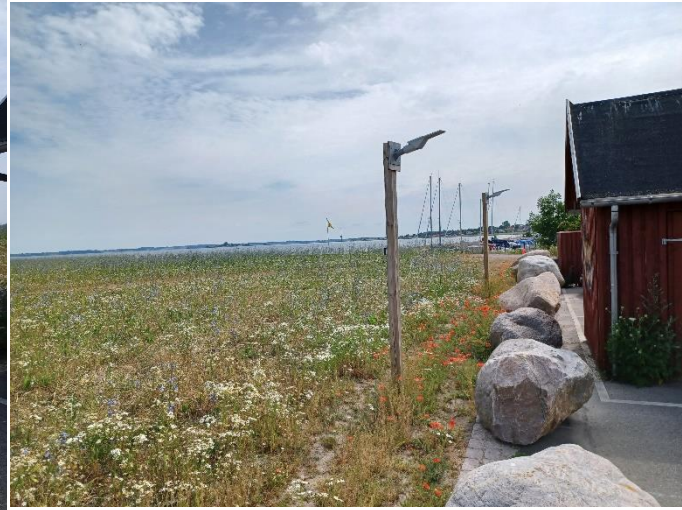
Bilag 2.: Billede taget mod nord og øst fra parkeringspladsen.