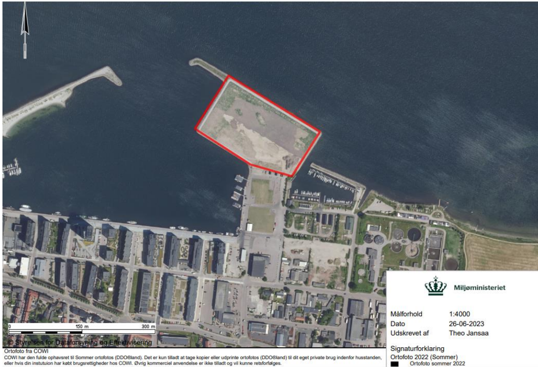
Billede 1.: Holbæk Havbundssedimentdepot