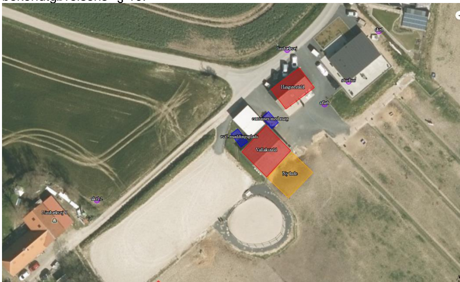
Figur 1. Oversigt over placeringen af den nye lade (gul) og eksisterende stalde (rød)

Sønderborg Kommune meddeler den 21. september 2020 , at den anmeldte lade kan opføres på Limbækvej 14, 6300 Gråsten matrikel nr. 12 Ladegård, Kværs på det oplyste grundlag, da det overholder betingelserne i bekendtgørelsens 1 § 10.