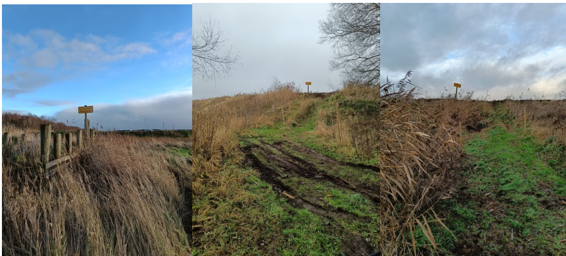
Figur 9.: Skilte og hegn opsat omkring deponierne billederne er fra Stånum og Drastrup Kær.

På tilsynet kunne det konstateres, at skiltning og hegn ved tilgangsveje var i orden, se figur 9. På depoternes nordlige side (ud mod fjorden), var der etableret lavninger i diget til indspulingsrøret, se figur 10. Det aftaltes, at Randers Havn får etableret kædeafspærring ved lavningerne i diget og fremsender fotodokumentation heraf senest d. 14. januar 2022 til Miljøstyrelsen.