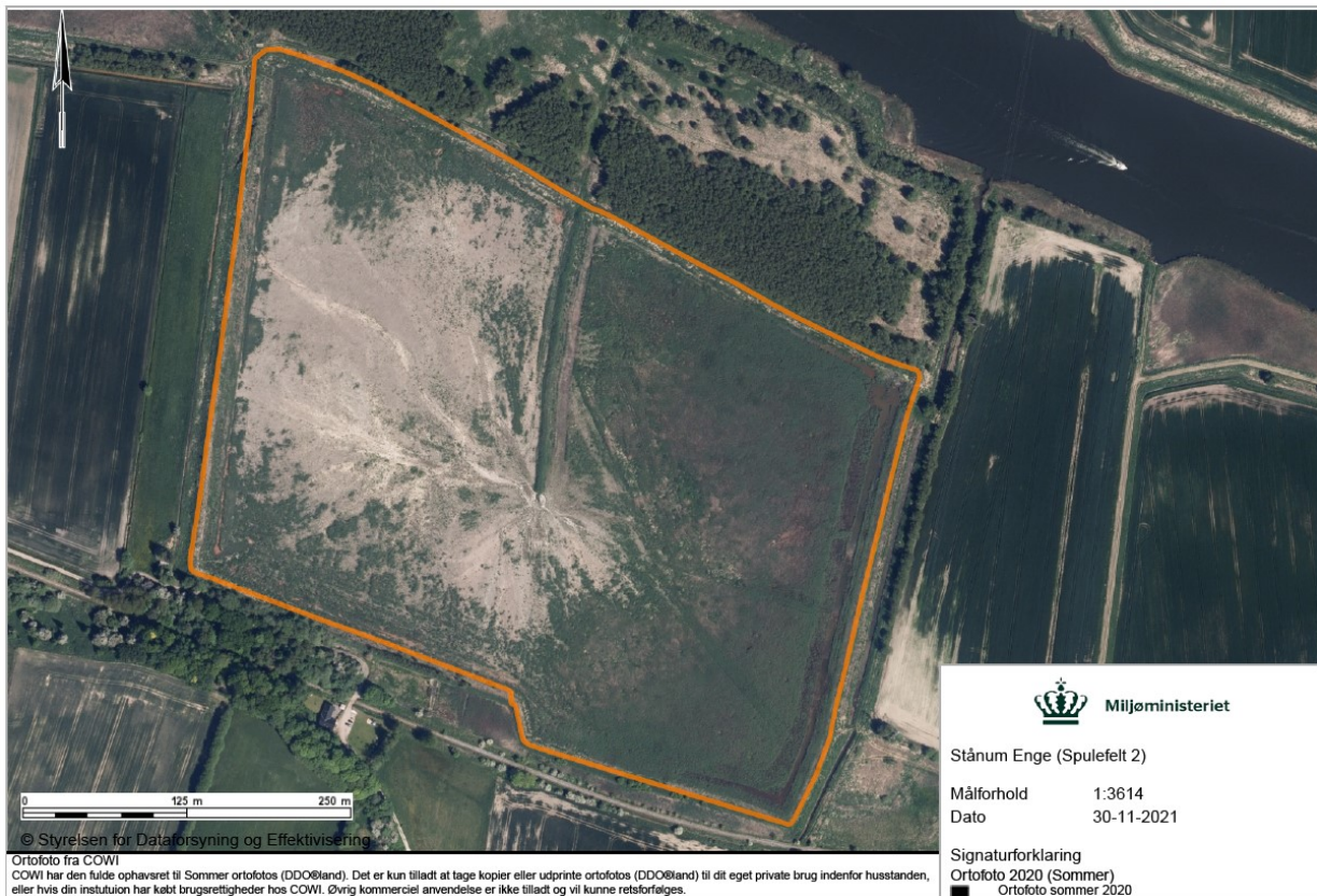
Figur 3.: Nærbillede af Havbundssedimentdepot 2 – Stånnum – optegning er en skitsering af det aktive havbundssedimentdepot