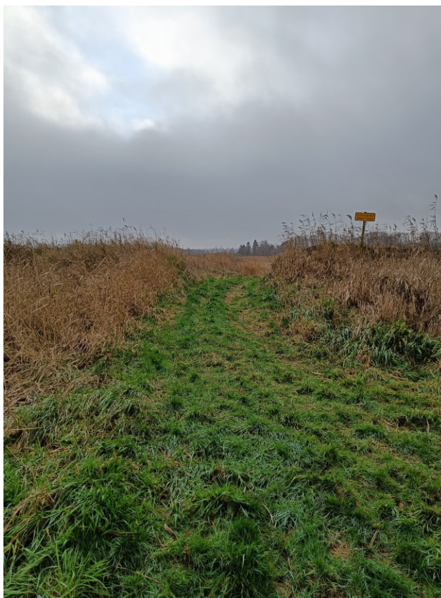
Figur 10.: Billede af nordlige dige-lavning taget på Stånum fra nord mod syd ind mod deponiet.