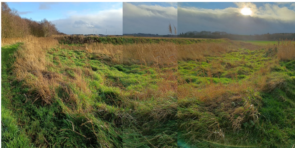
Figur 8.: Billede taget fra nordvestlige hjørne af Stånum. S sammensat af 3 billeder. Det forreste viser den resterende lave digekrone, hvor det originale dige stod, og bagest ses det nye dige.