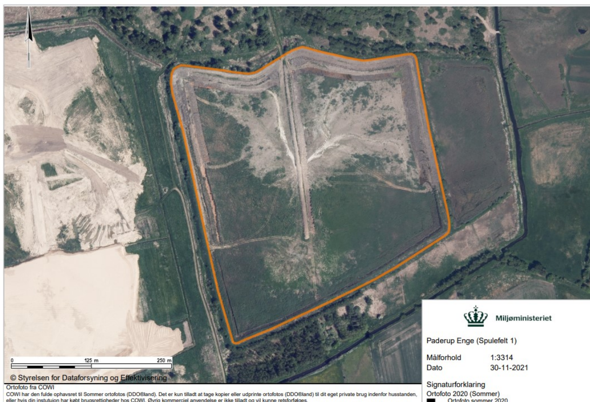
Figur 2.: Nærbillede af Havbundssedimentdepot 1 - Paderup Enge – optegning er en skitsering af det aktive havbundssedimentdepot