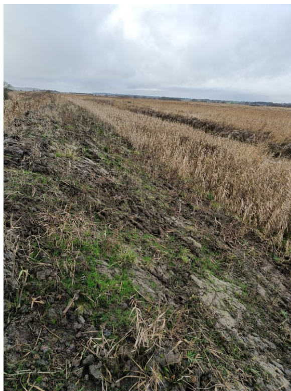
Figur 7.: Billede taget fra det sydøstlige digehjørne mod vest på Drastrup kær.