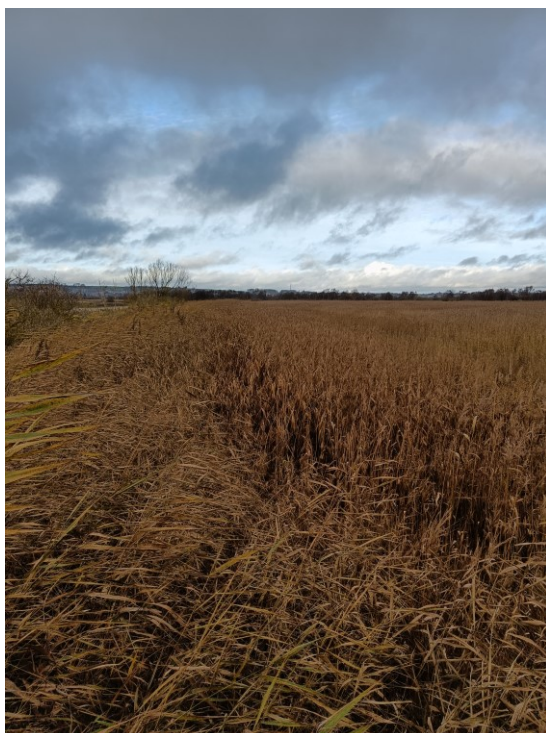
Figur 5.: Billede taget fra det sydvestlige digehjørne mod nord på Paderup Enge.