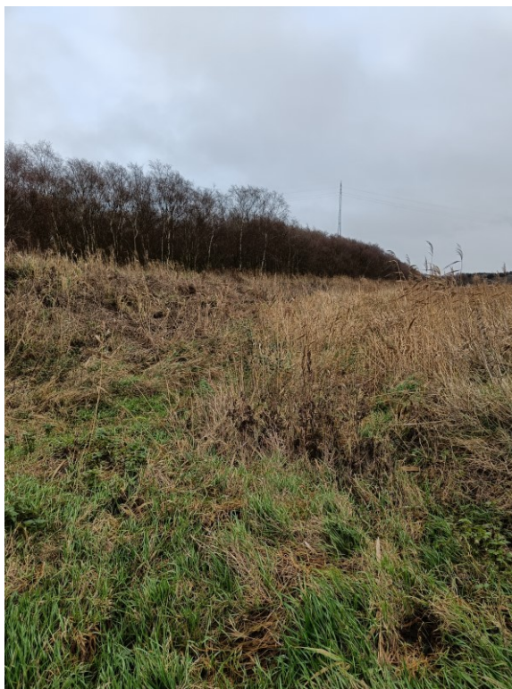
Figur 6.: Billede taget inde fra Stånnum mod det nordlige dige i nordøstlig retning.