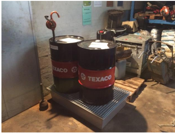
Lovlig opbevaring på spildbakke.