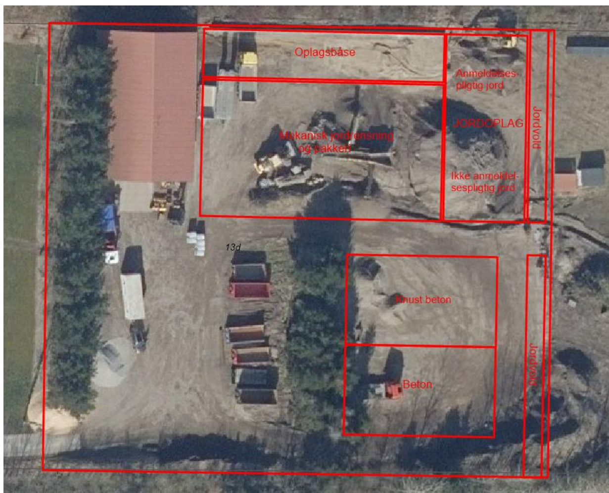
Figur 2 Indretning af entreprenørplads