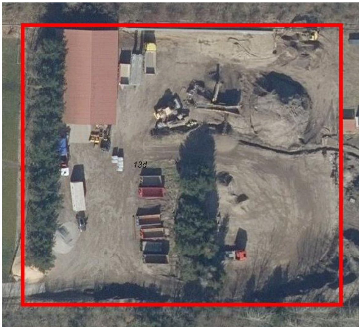
Figur 1 Virksomhedsområde