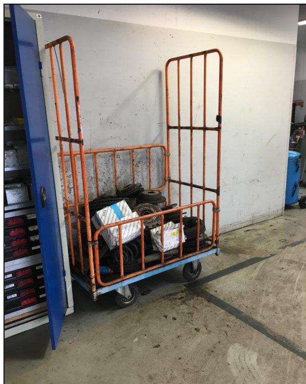
Foto fra affaldsopbevaring. Øverst til venstre fra udendørs opbevaring og de to øvrige foto fra indendørs opbevaring. Det findes ingen ophobning af affald. Virksomhedens affaldshåndtering foregår på tilfredsstillende måde.