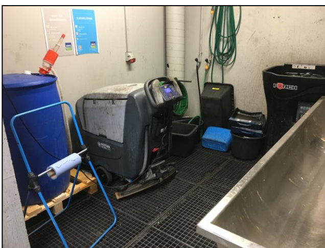
Foto fra olie/vaskerum placeret centralt i værkstedet. Der er etableret miljøbakker til opsamling af eventuelt spild.

Virksomheden har elektronisk drifts- og lagerstyring og opfylder kravene i Autobranchebekendtgørelsens §14 om journalføring. Oversigt over forbrug af råvarer for indeværende år blev vist på skærmen.