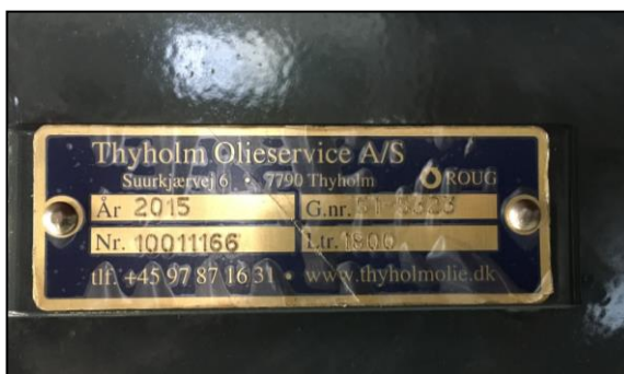
Foto fra olietank

Oplysninger om virksomhedens tanke er tjekket i BBR, hvor tidligere tanke nu er registreret som sløjfede og eneste registrerede tank er smøreolietanken.