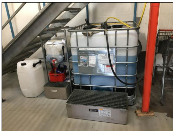
Foto af opbevaring af flydende råvarer/olier på miljøbakker indendørs. Kølervæske opbevares i 1.000 liters palletank ligeledes på spildbakke indendørs. Virksomheden har en smøreolietank på 1.800 l fra 2015.