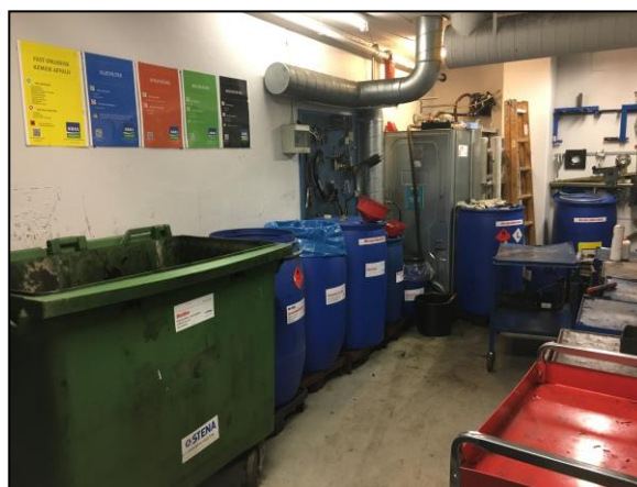
Foto af spildolie-tanken og dens placering.