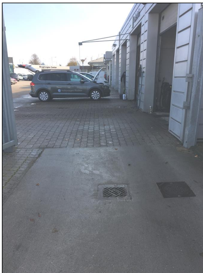
Foto af belægning og olieudskillere foran vaskehal (til venstre) og ved påfyldningsplads (herover).