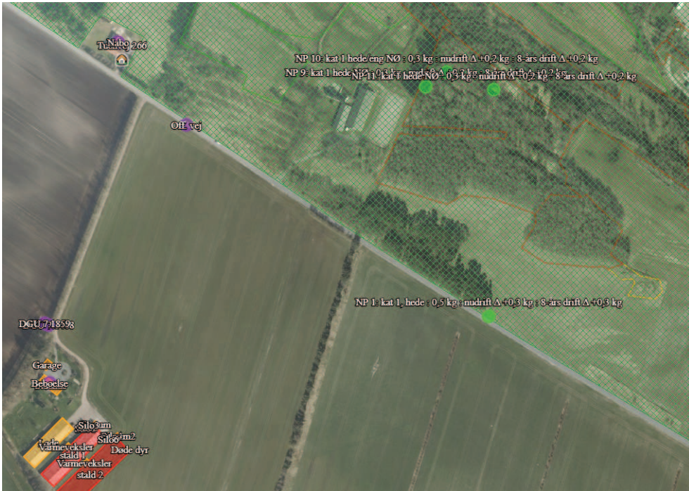
Kort over beregningspunkter for Kategori 1 natur