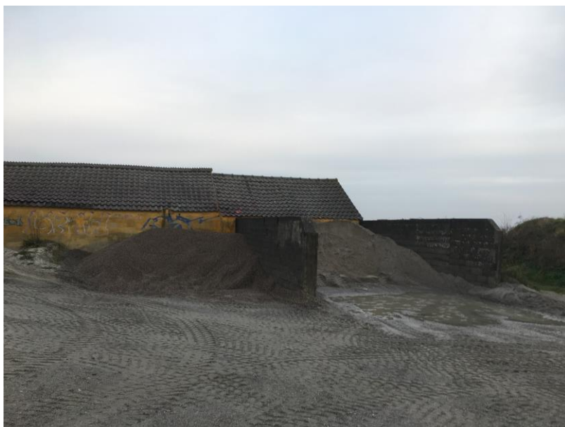
Oplag af sand og grus.