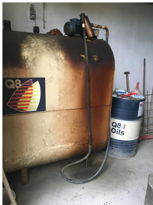
Dieseltank står i hal med fast belægning.