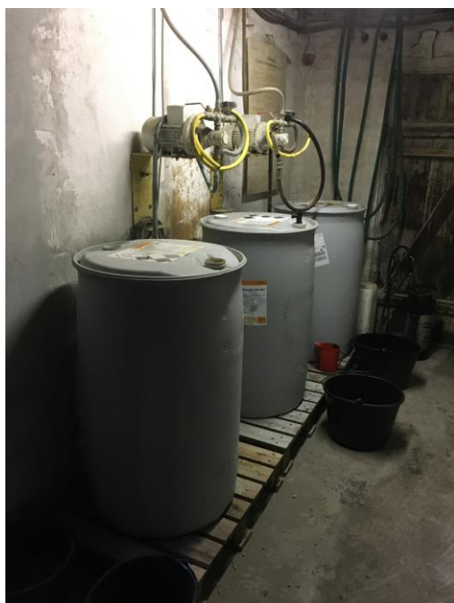
Tilsætningsstoffer, som tilføres manuelt til cementblanderen, opbevares uden spildsikring. Der er betongulv og ikke afløb fra rummet.