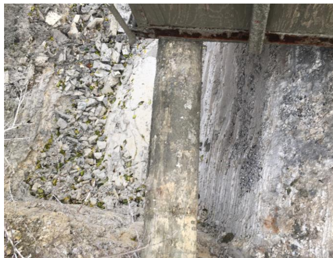
Bundfældningsbassin for rengøringsvand. Spildevandet hældes igennem risten for at frasortere sten.