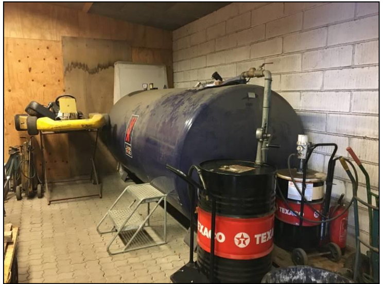
Foto af dieselolietanken

På Nordlandsvej 88A er følgende registreret i BBR: