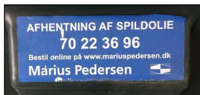
Foto af spildolietank