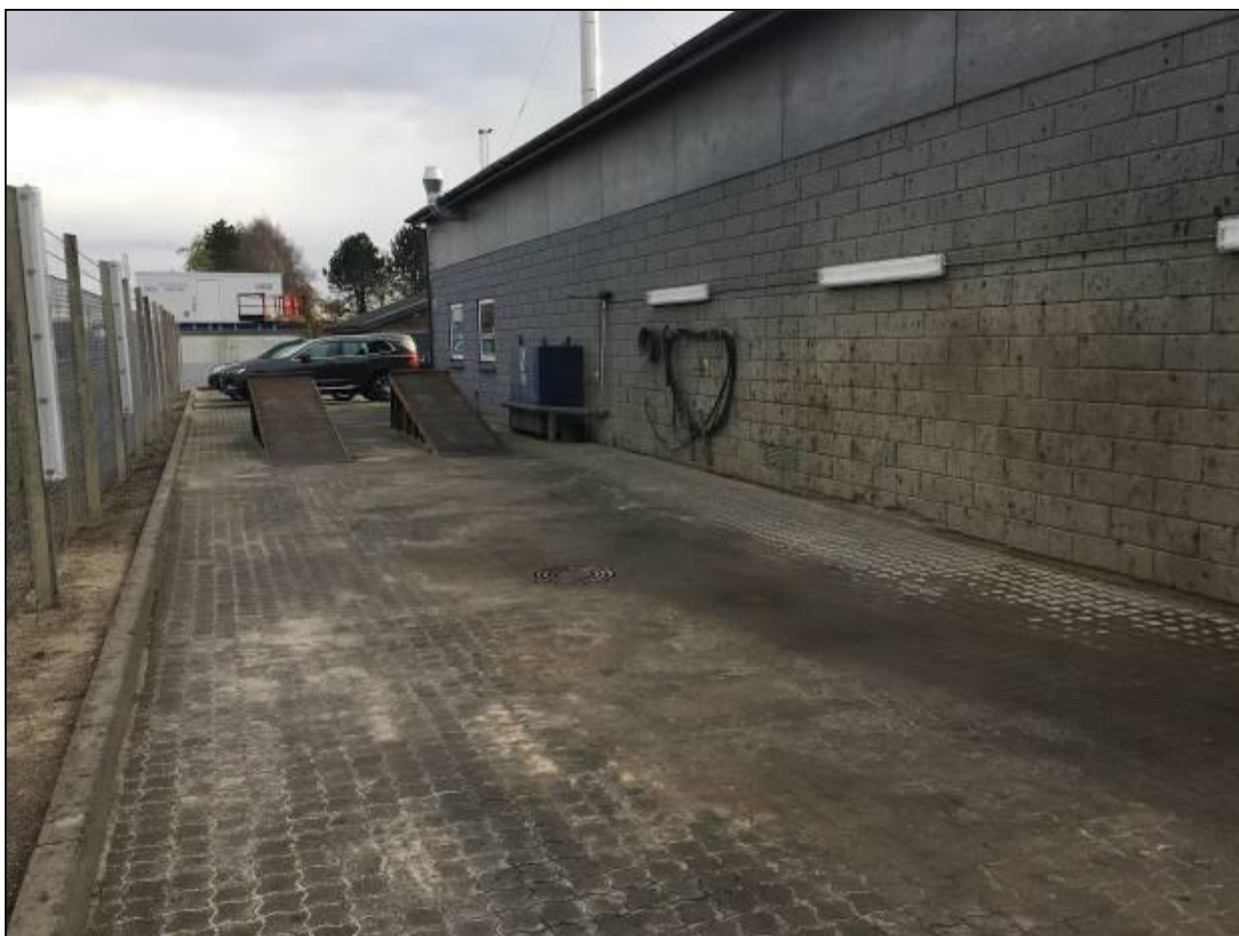
Udendørs vaskeplads med sandfang og olieudskiller. Fyringsolietank ved muren.

Virksomheden er tilmeldt den kommunale tømningsskema. Kvittering for tømning af HCS den 2. maj 2019 forevist. Her er anført 1.300 kg opslug. Desuden står der anført, at der ikke er koalescensfilter. Det bør lige rettes.