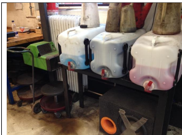
Foto 3 spinkler- og kølevæske