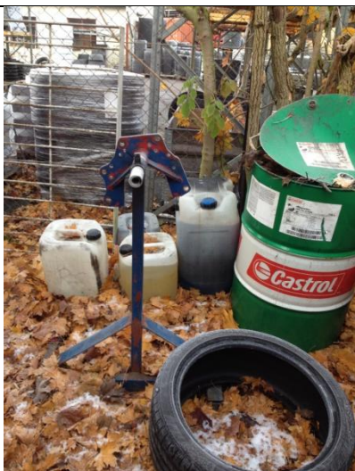
Foto 7 diverse dunke udenfor