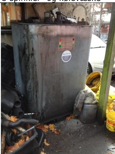
Foto 5 af spildolietank