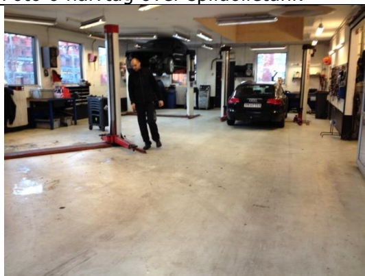
Foto 8 oversigtsbillede af værksted