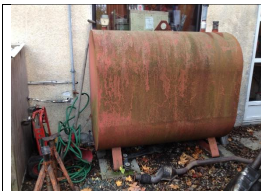
Foto 1 fyringsolietank på ubefæstet areal