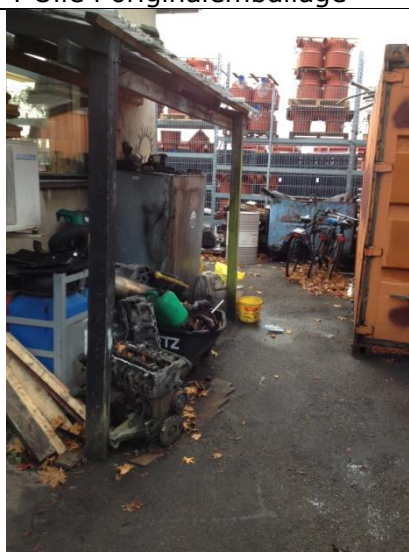
Foto 6 halvtag over spildolietank