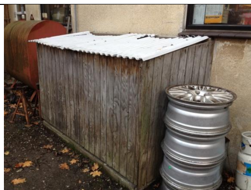
Foto 2 overdækning af kompressor