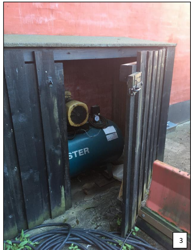
Foto 3 viser virksomhedens kompressor i det udendørs skur.

På tilsynstidspunktet var porten udfor nedkørslen til værkstedet åben. Det havde ingen støjmessig betydning, idet larmen fra byggeriet uden for langt overgik eventuel støj fra værkstedet.