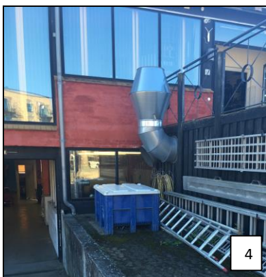
Foto 4 er taget uden for værkstedet og viser afkast samt opbevaring af brugte batterier i blå kasse.

Det er ikke oplyst om dette afkast er fra punktsug. I fald dette er tilfældet skal vi gøre opmærksom på, at afkast skal føres minimum 1 meter over tag iht. Autobranchebekendtgørelsens § 11. Stk. 3: Udstødningsgas, rensmiddeldampe og svejserøg skal udsuges fra indendørs lokaliteter. Afkast fra udstødningsgas, rensmiddeldampe og svejserøg skal føres mindst en meter over det sted på tagfladen, hvor afkastet er placeret.