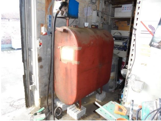
Tank til Dieselolie

På tilsynet sås en olietank på 1.200 l med dieselolie til materiel. Tanken var forsynet med mærkeplade, hvor det kunne aflæses, at den er fra 1988. Overjordiske olietanke under 6.000 liter skal sløjfes efter 30 år, med mindre, der er tale om tanke med særlig beskyttelse i form af offeranoder, dobbeltskrog eller lignende. Denne tank skal udskiftes senest i 2018.