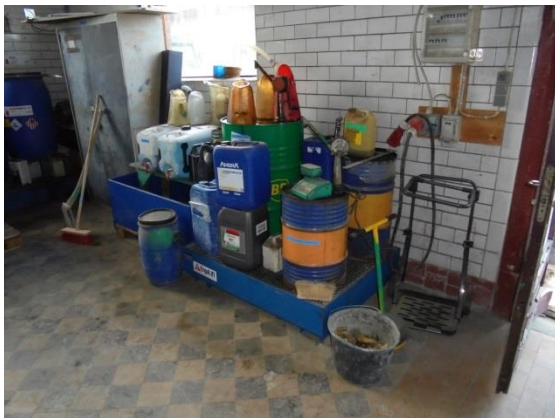
Flydende råvarer på spildbakke

I lageret ved siden af et mindre autoværksted opbevares forskellige flydende råvarer på spildbakker. Der er indgået en aftale med Stena om opstilling af plastfade til flydende farligt affald. Disse plastfade er ligeledes placeret på spildbakker. Der er ikke afløb fra lokalet.