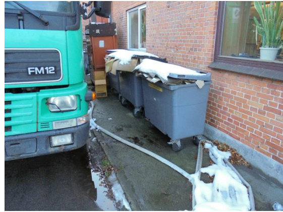
Containere til pap

Virksomheden har indgået aftale med Stena om at indsamle farligt affald i blå plastfade, der afhentes af Stena efter behov.