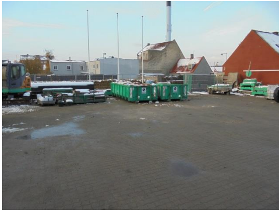
Containere til blandet byggeaffald og til rent jord

Virksomhedens byggeaffald bliver opbevaret i containere, udenfor bygningerne. Der findes desuden containere til pap i nærheden af administrationsbygningen.