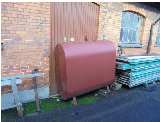
Fyringsolietank bag "PVC-værkstedet"

Den tank, der er placeret ved "PVC-værkstedet" er ikke fjernet som oplyst ved miljøtilsynet i 2015, da den lejlighedsvis har været benyttet i forbindelse med opvarmning i forbindelse med arrangementer afholdt i PVC-værkstedet for virksomhedens personale. Tanken er forsynet med mærkeplade, hvor det kan aflæses, at den er fra 2008.