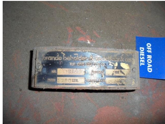
Nr: 889, Indh: 1.200 liter, Årgang: 1988

Den tank, der er placeret ved "PVC-værkstedet" er ikke fjernet som oplyst ved miljøtilsynet i 2015, da den lejlighedsvis har været benyttet i forbindelse med opvarmning i forbindelse med arrangementer afholdt i PVC-værkstedet for virksomhedens personale. Tanken er forsynet med mærkeplade, hvor det kan aflæses, at den er fra 2008.