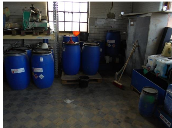
Plastfade til flydende affald på spildbakke