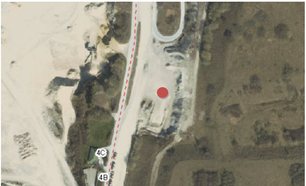
Pladsen til blanding af gips og kalk.