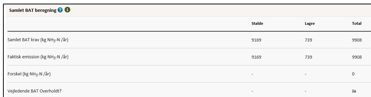
Tabel 3. BAT og ammoniakfordampning fra Store Hejbølvej 11.

Varde Kommune har i husdyrgodkendelse.dk beregnet BAT-krav for Store Hejbølvej 11. Se tabel 3. Den viser at BAT-kravet er overholdt. Alle stalde og gylletanke på Store Hejbølvej 11 er godkendt som BAT i tillæg til miljøgodkendelsen fra 2008. På den baggrund vurderer Varde Kommune, at Store Hejbølvej 11 lever op til lovgivningens krav om BAT på punktet ammoniak.